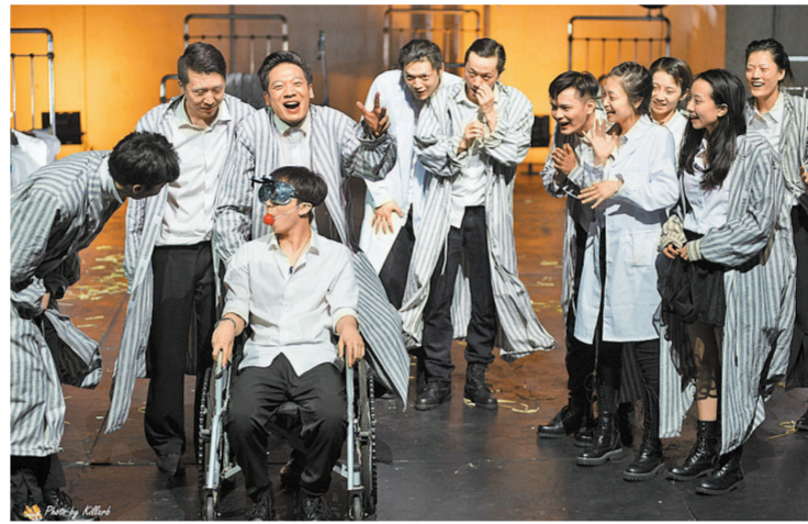
孟京辉《他有两把左轮手枪和黑白相间的眼睛》

在一带一路 音乐季的品牌带动下，短短一年时间，深圳舞台就迎来了 最强春季档。3月23日