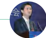
腾讯公司董事会主席马化腾出席高交会论坛并接受记者采访

——在1999年，我们参加了第一届高交会，才有这样一个机会接触到资本市场，能够第一次融资，这让腾讯有了腾飞的基础。