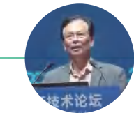
中国科学院院士、量子信息学家郭光灿出席中国高新技术论坛

——在1999年，我们参加了第一届高交会，才有这样一个机会接触到资本市场，能够第一次融资，这让腾讯有了腾飞的基础。