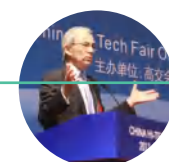
诺贝尔经济学奖获得者克里斯托弗·皮萨里德斯爵士出席高交会中国高新技术论坛

联系电话：0755-82848885, 0755-82848883, 0755-82849990 专业观众登记常年开放：cis.chtf.com