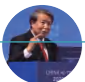
中国科学院院士郭爱克出席高交会中国高新技术论坛并接受记者采访

——信息技术的时代还将持续一个很长的周期，“十四五”仍然是信息技术发展的黄金时期。在“十四五”，5G将与IPv6、光纤通信、云计算、物联网、大数据、人工智能、区块链等新一代信息技术融合，并与产业技术深度融合，腾云驾雾融智赋能。