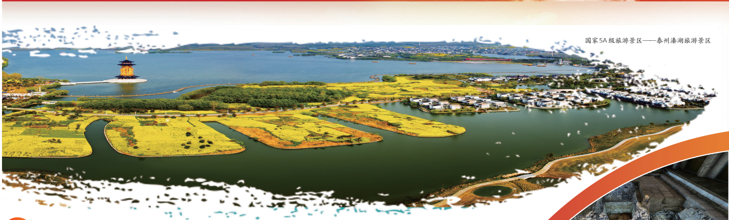
国家5A级旅游景区——泰州溱湖旅游景区