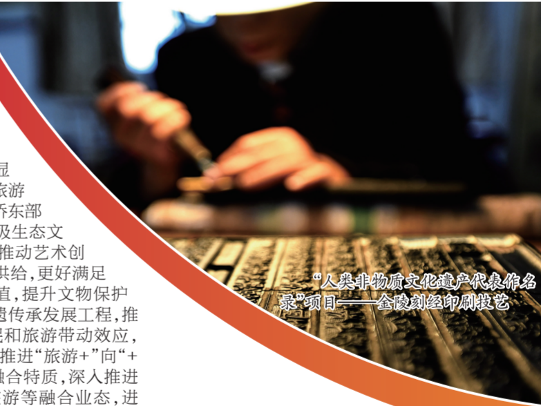
“人类非物质文化遗产代表作名录”项目——金陵刻经印刷技艺