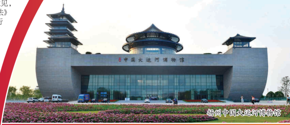
扬州中国大运河博物馆