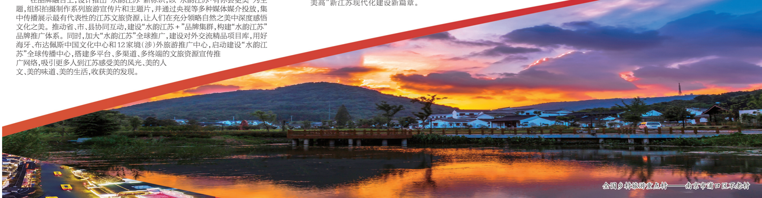
全国乡村旅游重点村——南京市浦口区不老村