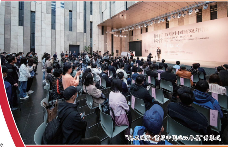
“抱石风骨·首届中国书画双年展”开幕式