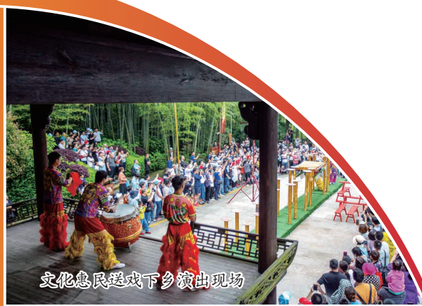
文化惠民送戏下乡演出现场