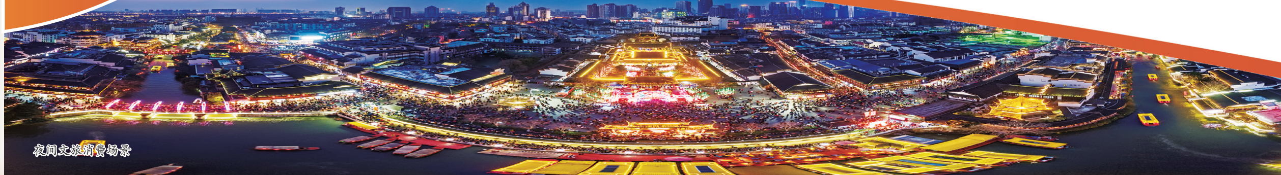
夜间文旅消费场景