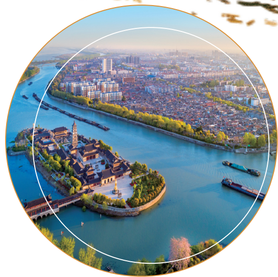
世界文化遗产——中国大运河 淮扬运河高邮段

江苏提出并落实对艺术工作者充分尊重、对艺术创作规律充分尊重、对艺术工作者辛勤劳动充分尊重“三个尊重”，建立完善财政投入、院团激励、人才培养“三项机制”，搭建有利于多出精品、多出人才各类平台。实施舞台艺术精品创作扶持工程，发挥江苏艺术基金“孵化器”作用，围绕全面小康、脱贫攻坚、抗击疫情、建党百年等重大主题组织创作，特别是今年围绕庆祝建党百年，遴选确定50部大型舞台剧目、20个小型舞台节目并组织展演，这当中包括新创一批红色主题剧目，昆剧《瞿秋白》、锡剧《烛光在前》、苏剧《太湖人家》、扬剧《阿莲渡江》等描摹时代底色的作品，为人民群众提供了丰富的精神食粮。坚持培养和引进相结合，专门设立江苏省戏剧文学创作院、江苏省书法院，创新实施新金陵画派青年人才培养计划，组织实施“大树移植”工程，建设高素质“艺术苏军”。组织覆盖所有门类的舞台艺术优秀青年演员展演活动，搭建全省基层院团优秀剧目省级展演平台，举办优秀美术家系列展，促进更多优秀艺术人才脱颖而出。打造艺术活动品牌，从2018年开始，我省与文化和旅游部联合创新举办戏曲百戏(昆山)盛典，经过3年集中展演，首次实现全国348个剧种“大团圆”，今年又重点围绕经典剧目、原创剧目、戏曲绝活组织展演，策划推出“新三年计划”，使之成为加强剧种建设、推动戏曲保护传承发展的重要活动平台。定期举办江苏省文华奖评选活动，并实行艺术评奖与文化惠民相结合，今年第五届江苏省文华奖评选有4万多名观众走进剧场、美术馆，1千多万人次线上观看。联合中国美协、中国书协，面向全国举办“抱石风骨”“散之风神”“悲鸿风度”美术书法品牌活动，让江苏文艺精品创作高地建设更有显示度。