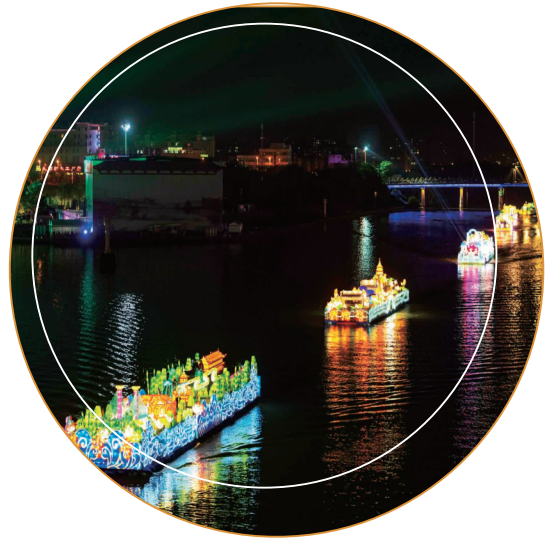
首届大运河文化旅游博览会

大运河是彰显“水韵江苏”独特魅力的闪亮名片。围绕助力江苏大运河文化带建设走在前列，全省文旅系统聚焦运河文化遗产科学保护和合理利用，编制出台大运河文化遗产保护传承、文化旅游融合发展两个省级专项规划，提出打造世界级运河文化遗产旅游廊道，并研究制定具体的实施方案；立足大运河全域，以“融合·创新·共享”为主题，自2019年起每年举办一届大运河文化旅游博览会，致力打造国际国内有影响的文旅融合发展平台、文旅精品推广平台、美好生活共享平台。今年9月举办的第三届运博会吸引超13.6万人次走进现场，线上受众超2.7亿人次；高水平建成开放扬州中国大运河博物馆，开馆以来每天1万人的预约名额常常“秒光”，已成为大运河国家文化公园建设的标志性项目和旅游网红打卡地；组织运河沿线8省(市)书画家，历时2年，创作完成长135米、高3米的《中国大运河史诗画卷》；绘制当代“清明上河图”；开展运河沿线文旅资源普查，建成运河文化遗产监测管理平台，实施一批沿线考古发掘、文物本体修缮和环境风貌综合整治工程，近两年安排省级以上文物保护专项资金6.3亿元，支持393个保护展示项目，在运河沿线设立9个省级文化生态保护实验区，推动运河文化创造性转化、创新性发展；设计推出运河主题旅游精品线路，集中推出“运河百景”标志性文旅产品，致力绘就一条历史与现代、文化与生态、自然与景观相得益彰的“水韵江苏”美丽中轴。