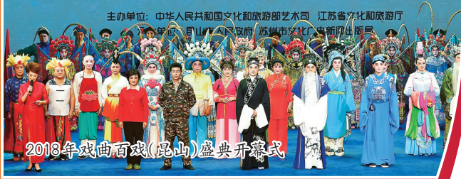
2018年戏曲百戏(昆山)盛典开幕式