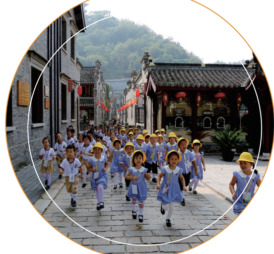
镇江西津渡儿童研学游