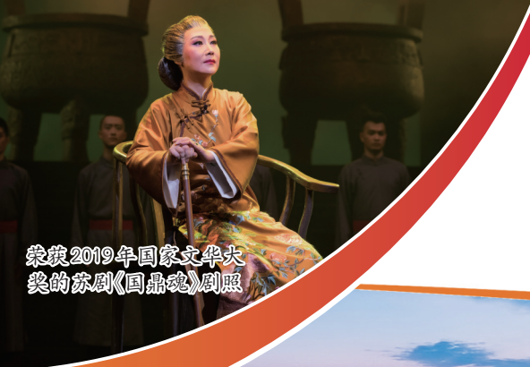
荣获2019年国家文华大奖的苏剧《国鼎魂》剧照