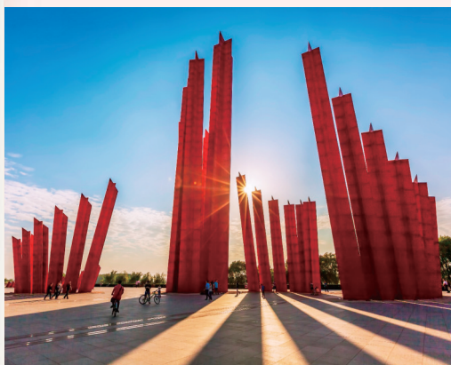
南京渡江胜利纪念馆

拙政园内，亭台楼榭，曲终人未散；黄海之滨，壮美世遗，万物皆共生；还有那秦淮河边，桨声灯影，最抚凡人心……回溯过去几年，在省委、省政府坚强领导下，全省文化和旅游系统依托“水+文化”融合特质，坚持以水为脉、以文铸魂，聚焦高质量发展、高水平融合、高品质生活、高效能治理，砥砺奋进、开拓创新，充分展现“水韵江苏”之美，努力打造令人向往的“诗和远方”。