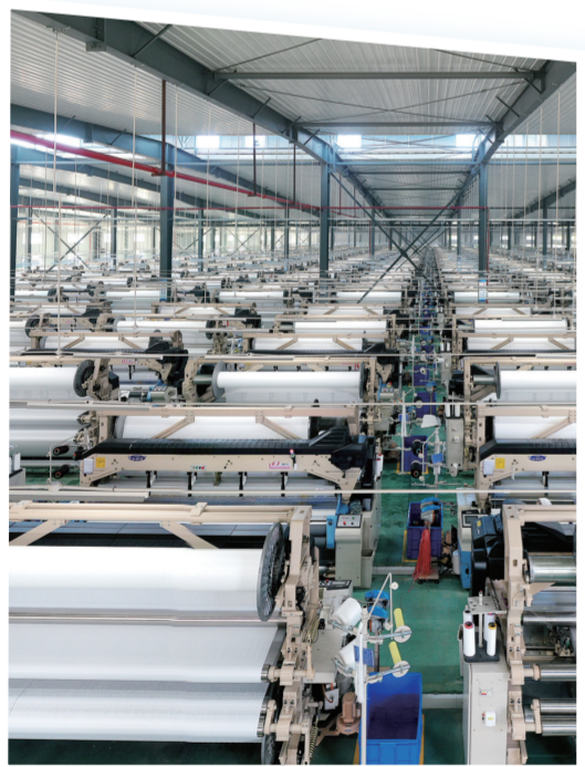
恒力集团纺织板块规模化长丝织造车间