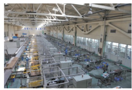
苏盐井神公司食盐包装车间