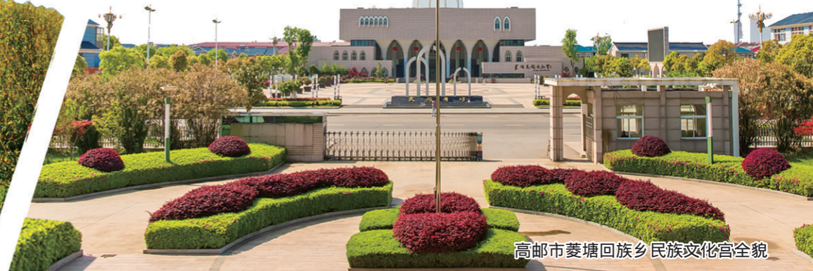
高邮市姜堰回族乡民族文化宫全貌