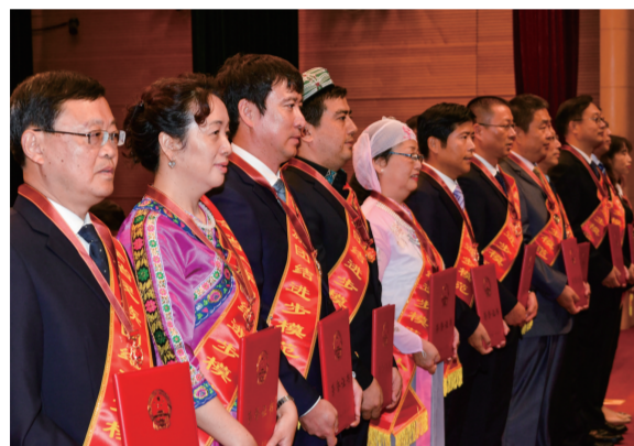
全省民族团结进步表彰大会

推动各民族优秀传统文化创新交融。正确把握中华文化和各民族文化的关系,各民族优秀传统文化都是中华文化的组成部分,中华文化是主干,各民族文化是枝叶,根深叶茂才能枝繁叶茂。以参加全国少数民族文艺会演等全国性民族文化展示活动为引领,举办形式多样的民族文化展示活动,举办全省少数民族文艺会演,支持各设区市每年举办少数民族文艺会演。推广普及少数民族传统体育项目,举办少数民族传统体育项目循环赛,组织好省运会少数民族传统体育项目比赛,做好第十二届全国少数民族传统体育运动会参赛工作。组织各族群众共同参加国家盛典、民族盛事,推动各族群众在相互了解、相互欣赏、相互学习、相互借鉴、取长补短、共同发展的基础上,实现感情相依、情感交融。苏民宣