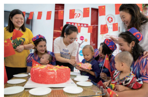
小小新海安人在社区石榴籽家园过生日