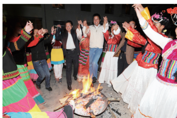
我省支教老师与云南宁蒍学生在一起