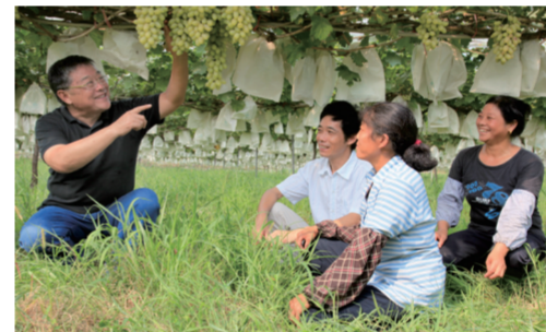
时代楷模 赵亚夫指导镇江市丹徒区世业镇卫星村少数民族群众科学种植新品种葡萄,大幅提升农户收入