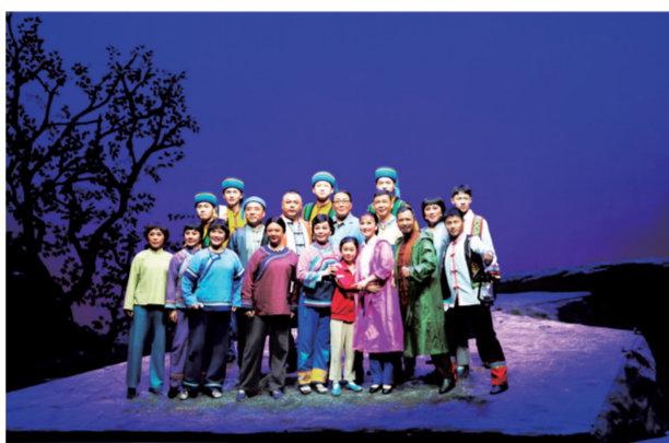
第六届全国少数民族文艺会演入选优秀剧目奖作品《追梦路上》