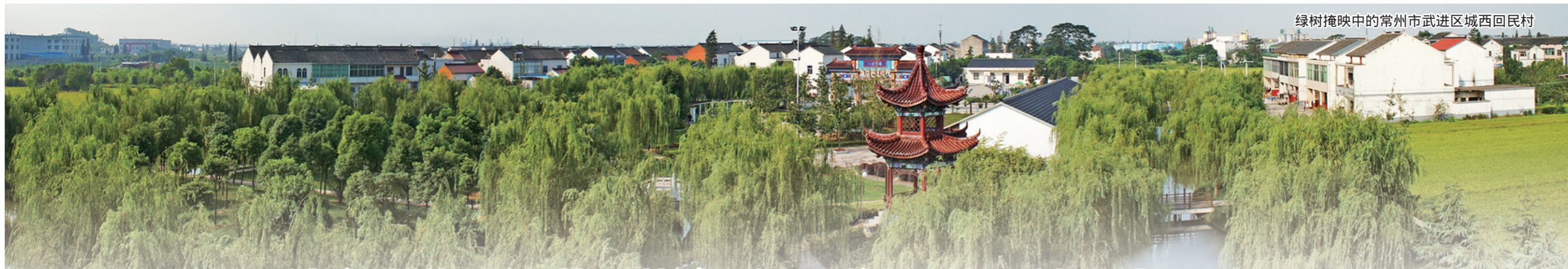
绿树掩映中的常州市武进区城西回民村