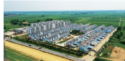
泗洪县梅花镇段庄特色村寨