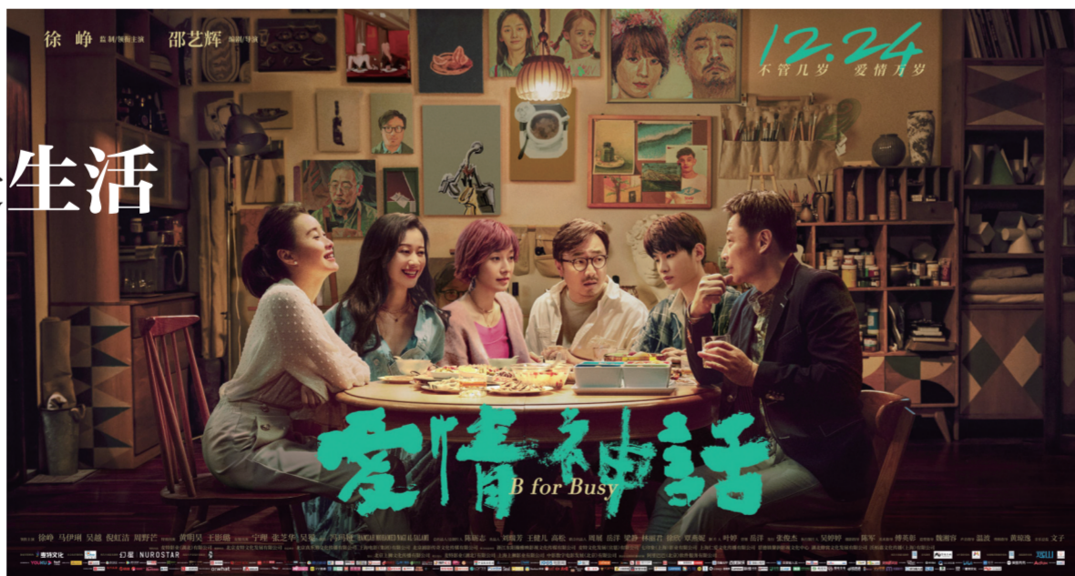
《爱情神话》电影海报

一个饭桌,一张沙发,一个阳台,一条马路……近期上映的国产爱情喜剧片《爱情神话》,把一群中年饮食男女的故事讲得“老嗲老灵”,将上海的精致、文艺、烟火气和文化包容力演绎得生动温馨,引人入胜。 由徐峥饰演的男主角老白是一位艺术家,中年离异,有一幢小楼自住兼收租,平时教人绘画,性格散漫。前妻蓓蓓,喜欢他的格洛瑞亚,令他颇不顺利的李小姐等三人接连搅乱他的生活,没有轰轰烈烈的感情,却有轻盈灵动的意韵。 不同于年轻人的干脆、急促,在进退有度的表面下,中年人的爱是柔软而舒缓的。不喜欢可以低头说一句,“走过的路不想再走”,回心转意也可以发一条微信,“明天一起喝咖啡吗”;是一句不咸不淡的“昨晚睡得好吗”的试探和委屈,是在别人问起几年不顺利的时候,笑着说“哎呀,下坡路走得能不顺吗”的心酸和释然。这些小情调、小心意,既是爱情,也是生活——经历过激情、冲动,整个人打破重塑,于是跟自