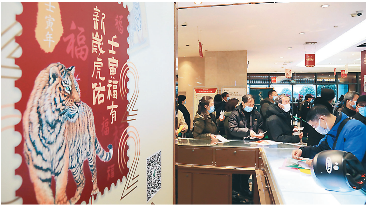
昨日,中国邮政发行《壬寅年》特种邮票。在南京龙蟠路的中国集邮专卖店,市民早早排起了长队,购买《壬寅年》特种邮票。