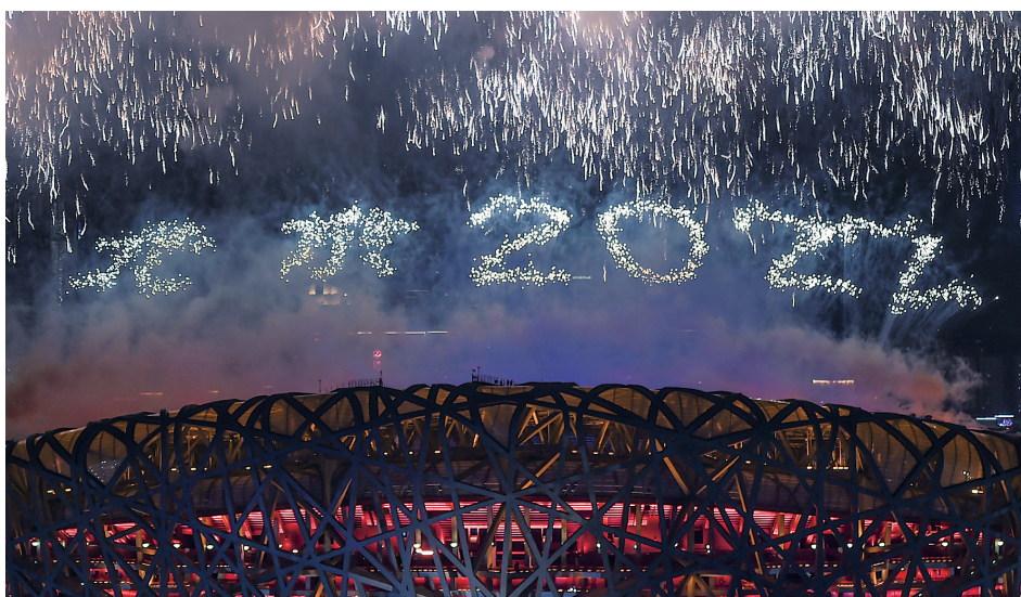
3月13日晚,北京2022年冬残奥会闭幕式在北京国家体育场举行。这是焰火表演。

北京理工大学马克思主义学院教授杨才林表示,中国圆满践行了“冰雪之约”,为世界倾情奉献了冬奥“中国方案”,充分彰显了中国共产党的强大领导力和中国特色社会主义集中力量办大事的制度优势。