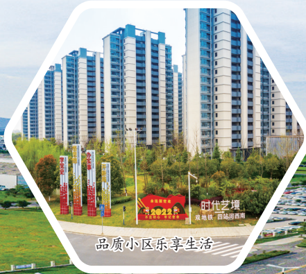
品质小区乐享生活