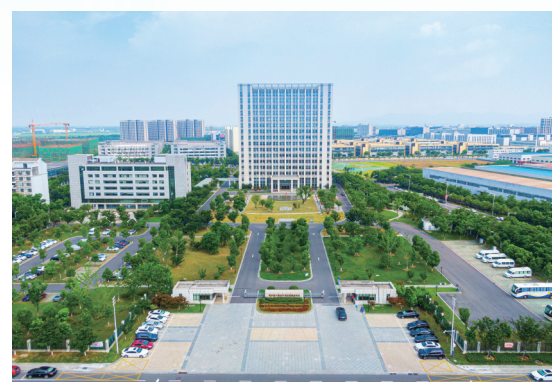
浦口经开区管委会