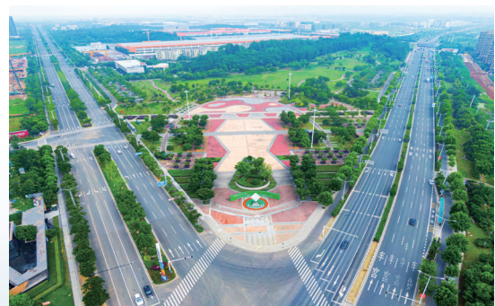
园区道路四通八达