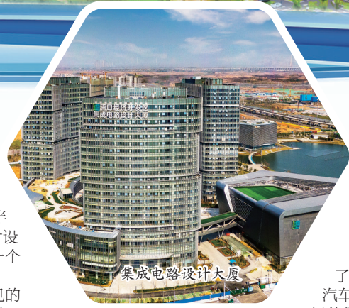
集成电路设计大厦

以南京依维柯为代表的高端交通装备产业，是浦口经开区的另一台“制造业引擎”。近年来，围绕整车制造、新能源、关键零部件等细分领域，园区快速集聚90余家相关企业，去年产业链上下游规模以上工业产值突破80亿元，初步