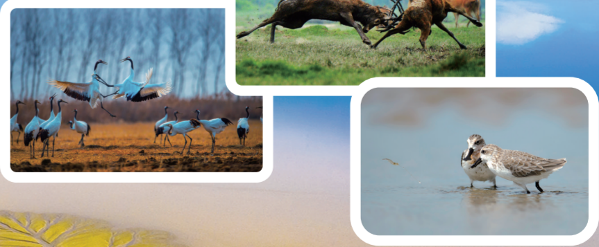
黄海湿地 吉祥三宝——麋鹿 丹顶鹤 勺嘴鹬