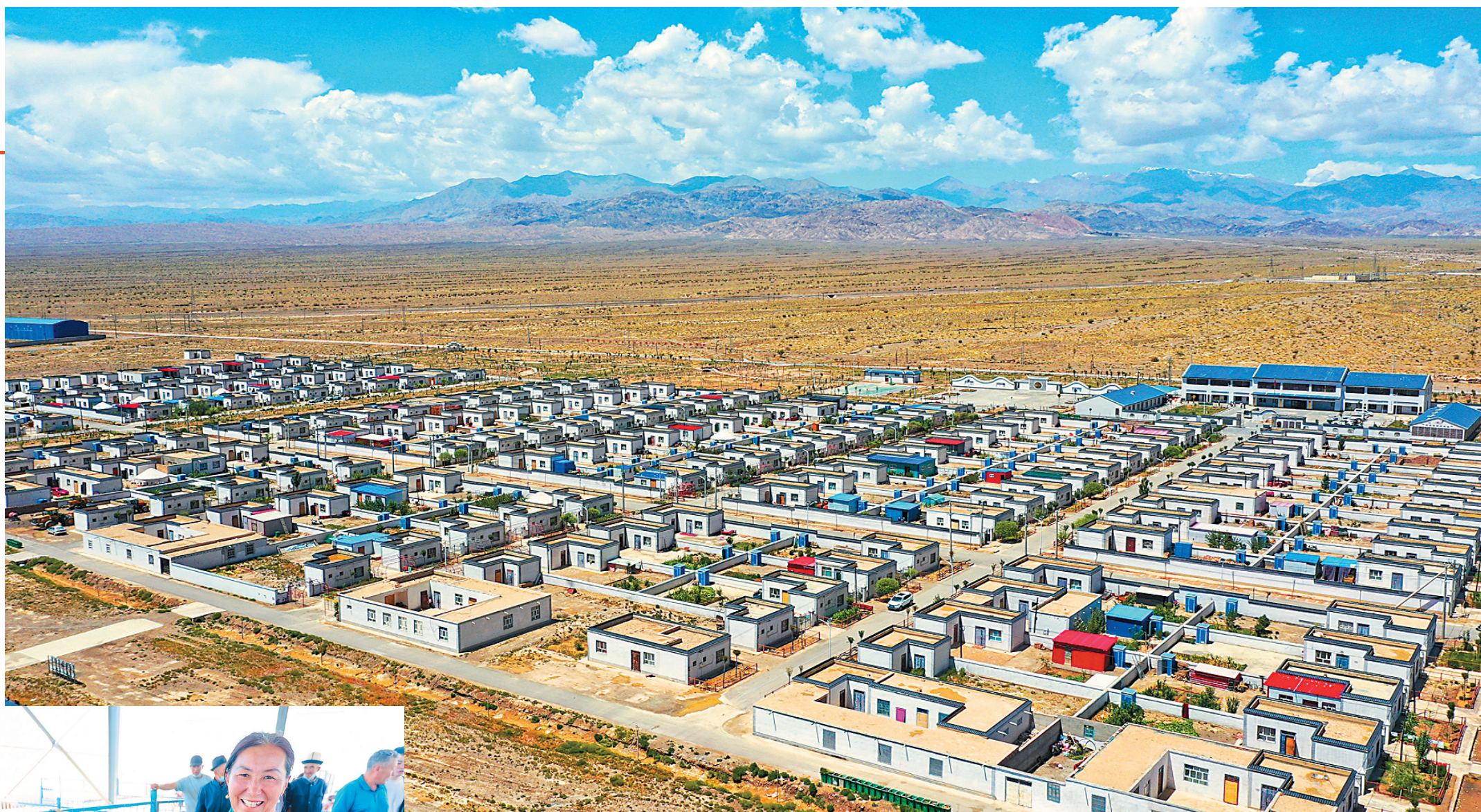
阿图什市哈拉峻乡克孜勒陶村在戈壁滩上构建出一派错落有致的美好画卷。