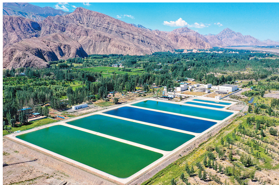
江苏援建的阿合奇县老城区污水处理厂,处理后的达标中水用于农田的灌溉。