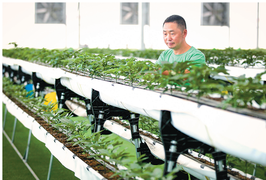
阿图什市阿湖乡智能育苗温室园区内,集无土基质栽培、循环水种植养殖、无土管道栽培等技术于一体,智慧农业赋能乡村振兴。