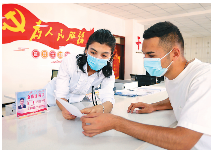
阿图什市幸福街道吾斯塘路社区政务(便民)服务站工作人员正在为民办事。