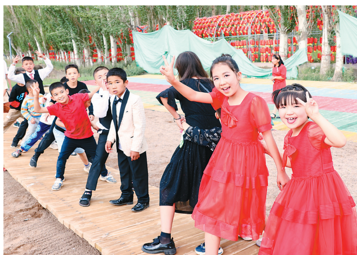
游客在乌恰县百合生态园内开心游玩。该园集“赏、吃、住、行、游、购、娱”为一体,为乡村旅游精准扶贫项目。