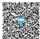
扫描“观·点”更多精彩视点