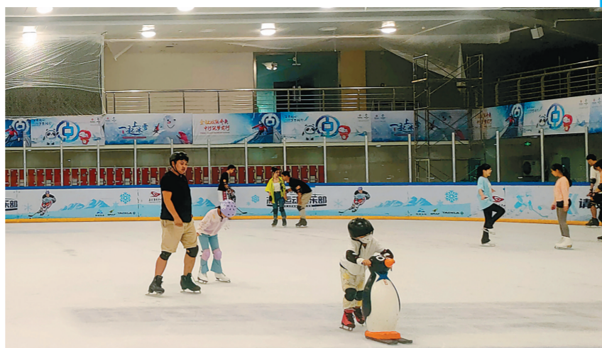
夏日,不少家长带着孩子在南京奥体中心冰上俱乐部体验滑冰的乐趣。

“冬奥会的成功举办激发了全民对奥林匹克运动的热情,真正让人们从认识、了解并参与了冰雪运动,各个设区的市场馆建设也给市民提供了方便,南方群众本身对冰雪项目就有