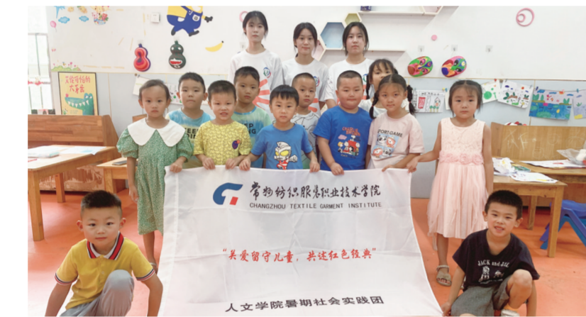
笔画出心中那一抹“中国红”。在共守小约定活动中,“小红星”社会实践团

在同读红色经典活动中,团队成员们精心挑选的红色绘本分发给小朋友们,并陪他们一起阅读、领读学习。在共述红色故事活动中,同学们鼓励小朋友站上讲台,用自己的方式将所理解的小故事说给大家听,引导孩子们用画