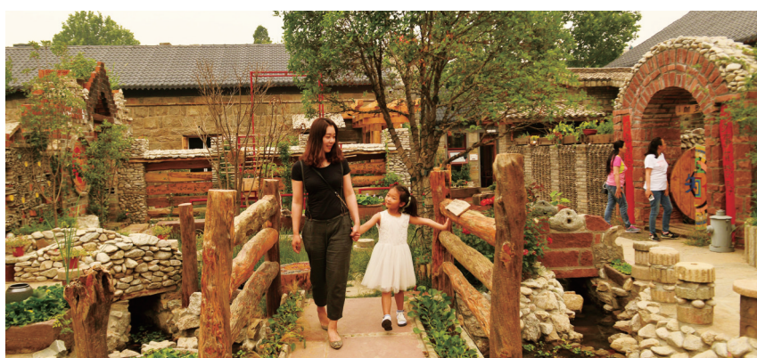
游客在宿城八间房民宿游玩。

时值暑期旅游高峰,在连云港连岛景区,身穿“红马甲”的江苏海州湾发展集团党员志愿者维护秩序、安全疏导、协调帮助,忙碌的身影不停穿梭于景区。今年,该区实施“景区党建”提升行动,设立党员先锋岗,划定党员责任区,让党员形象在景区闪光,助推海滨旅游火热发展。 夏日炎炎,大批游客来连云港“打卡”。“以前我们只在游客中心设置党员先锋岗,如今我们把党员先锋岗、游客服务站设到核心景点,让问题及时解决,游玩体验更舒适。”海发集团党委书记洪健表示。除了服务“零距离”,该集团还立足游客需求,划分