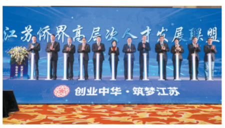
围绕人才强省建设打造工作品牌，举办“创业中华·筑梦江苏”——中国（江苏）侨界高层次人才峰会。