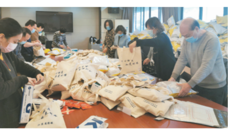
主动联系服务海外侨胞和留学生防疫抗疫，累计寄送口罩约60万只、手套约4万副、中药约2.4万袋。