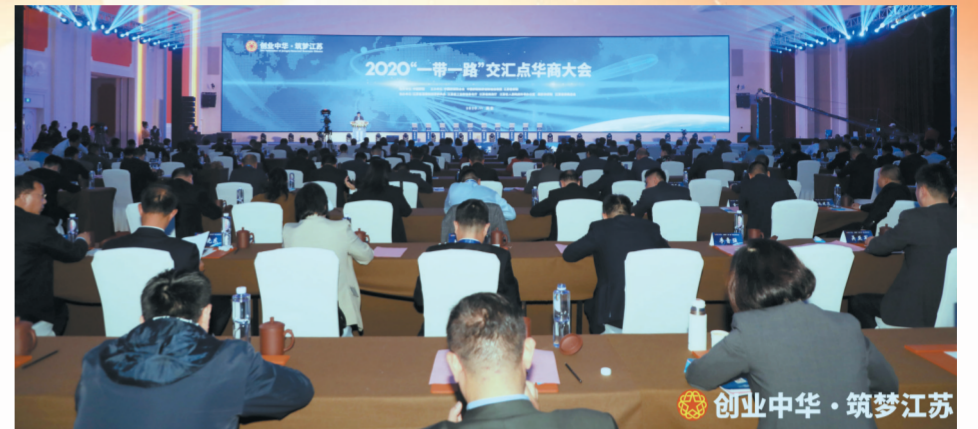
主动服务我省高水平对外开放，举办“创业中华·筑梦江苏”“一带一路”交汇点商大会。

团结就是力量，奋斗开创未来。中国梦是国家梦、民族梦，也是每个中华儿女的梦。广大侨胞有着赤忱的爱国情怀、雄厚的经济实力、丰富的智力资源、广泛的商业人脉，是实现中国梦的重要力量。只要海内外中华儿女紧密团结起来，有力出力，有智出智，团结一心奋斗，就一定能够汇聚起实现梦想的强大力量。