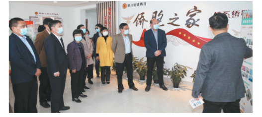
全省基层单位450余个“侨胞之家”服务阵地规范化建设水平不断提高。

历史总是在继往开来中阔步前进，事业总是在接续奋斗中发展壮大。“两个大局”交织激荡，“两个百年”历史交汇，未来五年，江苏省各级侨联组织将更加紧密地团结在以习近平同志为核心的党中央周围，全面贯彻习近平新时代中国特色社会主义思想，在省委、省政府的坚强领导下，勠力同心、踔厉奋发、破题开路、勇毅前行，切实履行“争当表率、争做示范、走在前列”光荣使命，奋力谱写“强富美高”新江苏现代化建设新篇章，为夺取新时代中国特色社会主义伟大胜利、实现中华民族伟大复兴中国梦作出新的更大贡献！