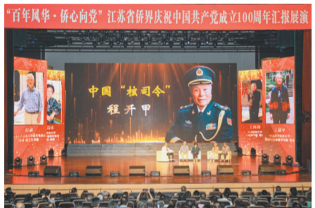
“百年风华·侨心向党”江苏省侨界庆祝中国共产党100周年汇报展演引发共鸣。

人心向背、力量对比是决定党和人民事业成败的关键，是最大的政治。全省各级侨联组织坚持以血缘、地缘、乡缘为基础，以亲情、乡情、友情为纽带，用心拓展联谊联络，用情联系服务侨界群众，努力画出同心圆，架起连心桥，有效激发侨胞爱国爱乡的桑梓情怀。一是联络联谊工作有突破。树立大侨务理念，有效承接并积极履行海外华侨华人社团联谊等职责，加入海外统战、港澳、涉外疫情防控等议事协调机构，完善出访来访、荣誉荐任、侨情调研等联谊工作机制，构建海外联谊工作系统规划、联动推进、协同发力的新格局，形成线上与线下、主题与常态相结合的联谊机制，联络联谊工作水平再上台阶。五年来，全省侨联系统累计接待海（境）外侨胞2.74万余人次，组团或参团出访400余人次。利用互联网平台“点对点”推送文化精品、亲情家书和节日祝福等，在海外35个国家合作共建38个“海外江苏侨胞之家”，中国侨联新一届海外顾问、海外委员聘任即到江苏参访；连续四年与中国侨联、南京大学举办“侨连五洲·相约江苏”海外联谊研修班，成为江苏侨联联谊工作的靓丽风景。二是涵养侨界资源有办法。针对侨界青年特点，指导省侨联青年委员会开展主题鲜明、受欢迎的“五色青春”系列活动，抒发“强国有我、侨青担当”的真挚情怀。承办中国侨联第四期海外华裔青少年论坛，举办“心手相连·青春有约”苏港澳青少年交流活动，增进国家认同。海外疫情蔓延后，号召各级侨联组织“反向捐赠”，为海外侨胞和留学生寄送口罩约60万只、手套约4万副、中药约2.4万袋。组建微信关爱群，设立24小时值班电话，在海外建立留学生志愿服务关爱站，提供政策推送、心理疏导、中医指导、求助协调等服务。三是关爱老侨有温度。联合有关部门、高校推动关爱老归侨“一对一”志愿服务公益项目落地，连续四年举办电影招待会和老归侨集体祝寿活动，深受好评。用好侨务专项经费和侨爱心善款，为全省老归侨购买大病保险、发放补助金。五年来，各级侨联共走访慰问归侨侨眷2.3万余人次，发放慰问金1700余万元。四是维护侨益有手段。连续五年在全省侨联系统开展“法治宣传月”活动，营造依法维护侨益的社会氛围。积极宣传《江苏省保护和促进华侨投资条例》等涉侨法律法规，参与执法检查，推动优化营商环境。完善涉侨纠纷多元化解工作机制，相关经验在全国侨联系统推广。在有关部门和单位支持下，组建新的省侨界法律顾问委员会，充实优化工作力量，并首次聘任海外委员，全面提升依法维权综合能力。加强维权工作部署、业务培训 and 特邀调解员队伍建设，褒扬维护侨益典型案例，推广各地创新做法，完善重点案件督办、信访登记通报、主席接待日、公职律师等制度，促进侨界和谐。五年来，各级侨联处理来信1100余件，接待来访4600余人次，协助解决涉侨纠纷和案件500余起。弘扬侨界热心公益的优良传统，做好定点帮扶、困难群众帮扶、社会帮扶等工作，“侨爱心工程”惠及面广由省内向全国延伸，影响面也不断扩大。