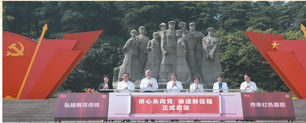
举办“侨心向党 奋进新征程”动员大会，激励侨界人士砥砺前行同圆共享中国梦。

坚持把党的领导贯穿始终，增强“四个意识”、坚定“四个自信”、做到“两个维护”、捍卫“两个确立”。坚持不懈武装头脑、与时俱进指导实践、扎扎实实推动工作，努力把真理伟力转化为同圆共享中国梦的磅礴力量，实现党有号召、侨有行动。一是加强政治建设。始终将讲政治作为侨联组织的根本属性，自觉同以习近平同志为核心的党中央保持高度一致，深刻认识“两个确立”的决定性意义。坚持政治立身、涵养忠诚大德，扎实开展“两学一做”学习教育、“不忘初心、牢记使命”主题教育、党史学习教育，广大侨联党员干部理想信念更加坚定，政治忠诚更加牢固、工作作风更加务实。二是强化理论武装。通过理论宣讲、专题培训、讲座讲堂等多种方式，加强群众化、精准化思想政治引领，引导侨界群众准确理解党中央、省委要求，做到学思用相结合、知行相统一。承办2020习近平总书记关于侨务工作重要论述研讨会，在学习讨论中不断汲取奋进的智慧和力量。三是激发奋进力量。紧扣鲜明主题主线，举办庆祝改革开放40周年分享会、“一路同行·侨耀江苏”盛典、“亲情中华·张謇故事”专场演出、“侨心向党 奋进新征程”动员大会、“百年风华·侨心向党”汇报展演 主题书画艺术展、海外侨胞祝福北京冬奥、“苏侨赤子心”等群众性宣传活动，弘扬爱国爱乡的光荣传统，在侨界树立好典型、激发正能量。