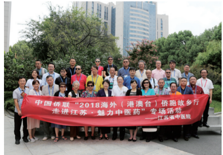
出席“2018海外（港澳台）侨胞故乡行——走进江苏”文化遗产寻访之旅的50余名海外嘉宾访问江苏省中医院，开展“魅力中医药”专场体验活动。

引力。高标准承办中国侨联海外华裔青少年“中国寻根之旅”夏（冬）令营，首次线下办营14期，累计1028名青少年来苏实地感受新江苏的魅力。按照“一营一主题”方式，优化“亲情中华·为你讲故事”江苏网上营组织，将特色营与常规营相结合，更加生动立体活泼地展示地域文化，受到一致好评，参营青少年位居全国首位。精心推出“亲情中华·年味江苏”云端系列活动，在全国侨联系统率先举办全球华侨华人网络厨艺大赛、全球华裔青少年网络才艺大赛等活动，刷屏海内外朋友圈，关注点击量超过3000万，提升了江苏在海外的影响力。三是对外宣传更具亲和力。发挥侨界文化交流基地功能，打造文化展示方阵，成功申报中国华侨国际文化交流基地38家，数量位居全国第一；命名省级侨联文化交流基地180家，推动江苏对外文化交流。围绕侨联服务国际传播能力建设深入调研，开展专题研讨，发挥高校资源优势共建中华文化国际传播研究基地。服务大运河文化带建设，连续三年举办“追梦中华·亲情大运河”海外华文媒体江苏采访行等活动，累计原创发稿1100多篇，网络阅读量超过2000万次，向海外讲好江苏故事。