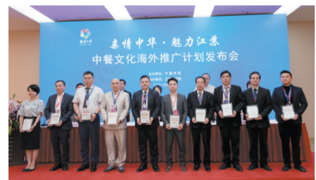
实施《中餐文化海外推广三年计划》，在海内外共建立10个中餐文化海外推广基地，118个中餐文化海外推广中心，聘任118位中餐文化海外推广使者。