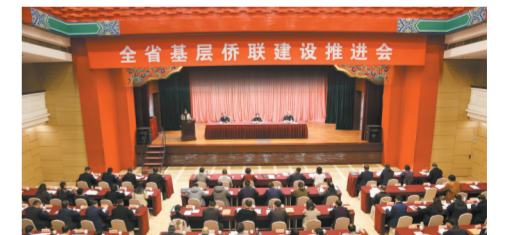
召开全省基层侨联建设推进会，推动基层侨联“应建尽建”。