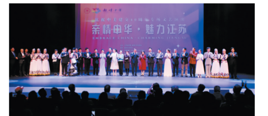
组织“亲情中华·魅力江苏”艺术团赴美国洛杉矶进行慰问演出，促进中美民间友好。