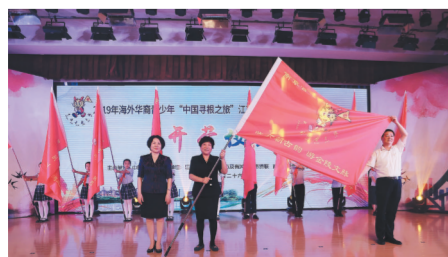
高标准承办中国侨联海外华裔青少年“中国寻根之旅”夏（冬）令营，“一市一主题”，首次线下办营规模超过1000人。