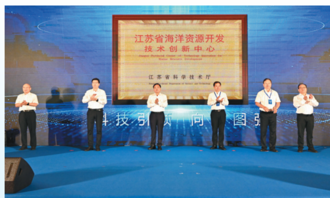
省海洋资源开发技术创新中心正式揭牌。

认识海洋,开发海洋的核心是装备,该技术创新中心重点建设海洋高端装备技术创新中心,搭建智能运载平台、智能立体感知网络平台、智能数据分析与服务平台、综合集成和公共支撑平台、领域计算与智能应用平台,整合全球海洋装备科研优势,努力实现海洋装备产业链的跨越式发展。