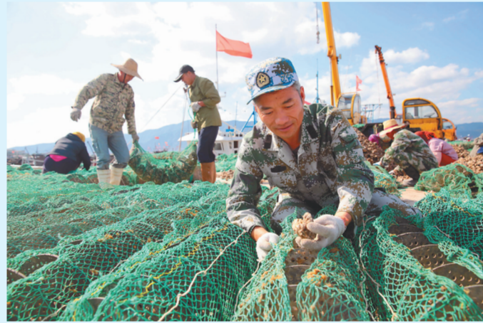
牡蛎养殖技术升级换代助力渔民增收。