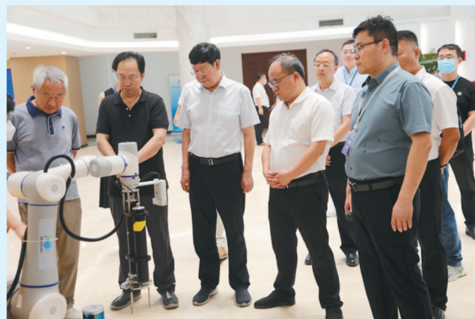
院士专家与当地领导参观考察采样机器人等海洋智能装备创新项目。