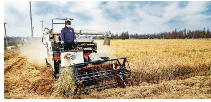
禄口街道种粮大户利用机械收割水稻