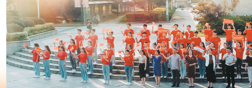
学校开展思政教育活动