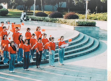
学校开展思政教育活动