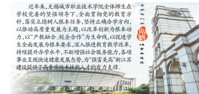
无锡城市职业技术学院校门

学校坚持和加强党的全面领导，深刻领悟“两个确立”的决定性意义、树牢“四个意识”、坚定“四个自信”、坚决做到“两个维护”，以党的政治建设为统领，突出思想引领，夯实党建基础，着力推进党建工作创新创优。 坚持把理论学习摆在重要位置，通过“党委主导学，支部主体抓，个人自主学习”三级学习机制，党委理论学习中心组、第一议题等学习制度，“四进”品牌活动等，推动理论学习走深走实。牢牢把握意识形态工作领导权，严格落实意识形态工作责任制，壮大主流思想，加强舆论引导，强化阵地建设，筑牢意识形态安全防线。全面开展基层党建标准化规范化建设，实施教师党员先锋工程、教师党支部书记“双带头人”培育工程、“党建+”工程、青马工程和党建党员量化管理工程等五大工程，合力打造“引领先锋、党建先行”党建品牌。加大年轻干部选拔任用力度，建立后备年轻干部人才库，选派7名干部参加市委组织部干部挂职锻炼。干部队伍的年轻化、知识化、专业化水平不断提升。切实打牢全面从严治党基础，持续加强党风廉政建设和反腐败斗争，营造风清气正的政治生态。 学校蝉联江苏省文明校园，荣获江苏教育新闻宣传工作先进单位，省市教育信息工作表扬单位、江苏省最佳主题党日学校、省市先进基层党组织、全省教育纪检监察先进集体、江苏省廉政文化示范点等荣誉。