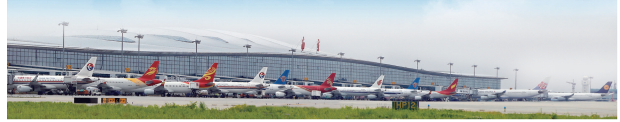
禄口国际机场航站楼及跑道

洪武二十六年，明朝皇帝朱元璋“集天下工匠于京师”，禄口成为江南皮毛文化形成、延续和发展的主要地区。禄口皮草制作技艺精湛，被列入省级非物质文化遗产代表性项目名录，正在筹备申报国家级非遗、“禄口皮草”国家地理标志。 由商务部批准的2022南京禄口国际皮草时装周即将举办，在连续成功举办两年后，第三年将由商务部批准升级为中国字头展会——中国（禄口）国际皮草时装周。历经600余年的传承与发展，禄口已成为中国皮草制造业的重要基地，大批禄口皮草匠人从这里走出，支撑了中国皮草产业发展，开创了非遗传承发展的生动局面。 将镜头转移到禄口大地。这里有着绵延十里的锦绣，也有跨越千年的风华；有鸿生巨儒的足迹，也有翰墨书圣的后裔；有文人雅士的锦绣诗篇，也有数不清的非遗文化瑰宝；高效生态农业与休闲观光旅游相结合，红色文化架起点亮精神之光的“跨时空对话”。古老的文化以另一种方式被传承守望，生生不息的文化为这片沃土的持续繁荣注入不竭的动力。 锣鼓敲起来，老街逛起来，高台狮子舞起来，挥毫泼墨写起来……曹村，东晋“书圣”王羲之后人聚居地，一个有着900多年人文历史的古镇，每天都迎来全国各地的游客和书法爱好者，焕发勃勃生机。 在这片充满诗意的沃土，美丽乡村的梦想，正成为空间的连接，想象力的探索，延续着无限可能。 “打造非遗新IP，赋能乡村振兴”，发展大幕已经拉开。