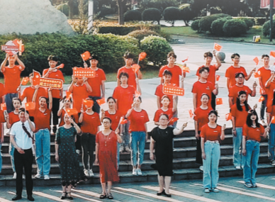
学校开展思政教育活动