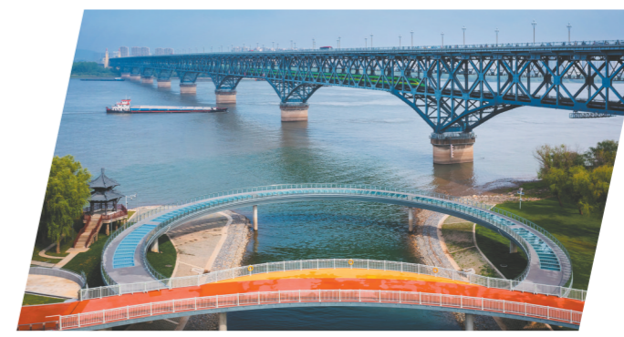
南京长江大桥与彩虹桥