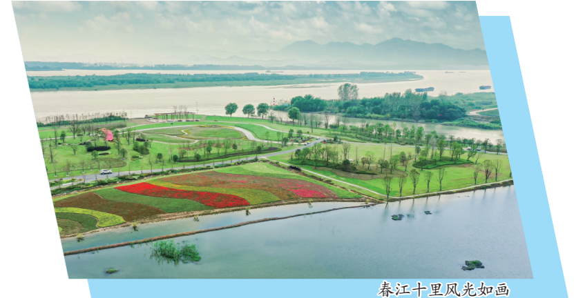
春江十里风光如画

民生服务一体保障。更加注重民生服务从各自发展向整体协作转变，实施区域就业精准对接行动，集聚两区合力吸引更多优质教育、医疗资源，健全与新区在疫情防控、防洪排涝、道路运输安全等领域常态化协作机制，共同推进区域社会治理现代化。 十年砥砺前行，时间记录了一段波澜壮阔的发展史；十年起步点，拥抱新的时代机遇，浦口仍将保持战略定力，以滚石上山、人一我十的拼搏姿态，推动经济社会高质量发展，用现代化新浦口建设的实际行动，喜迎党的二十大胜利召开！