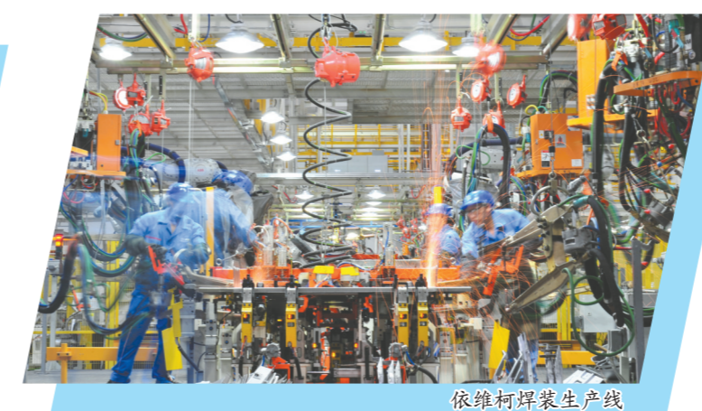
依维柯焊装生产线