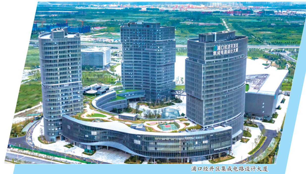
浦口经开区集成电路设计大厦