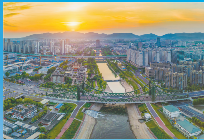
浦云路大桥成网红打卡地