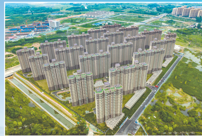
新建成的保障房小区