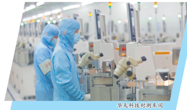
华天科技封测车间