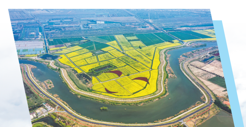
滁河两岸花海绽放