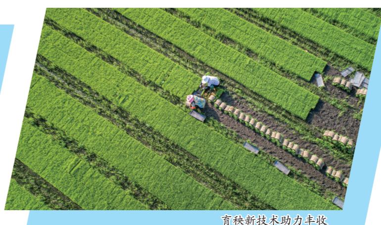
育秧新技术助力丰收