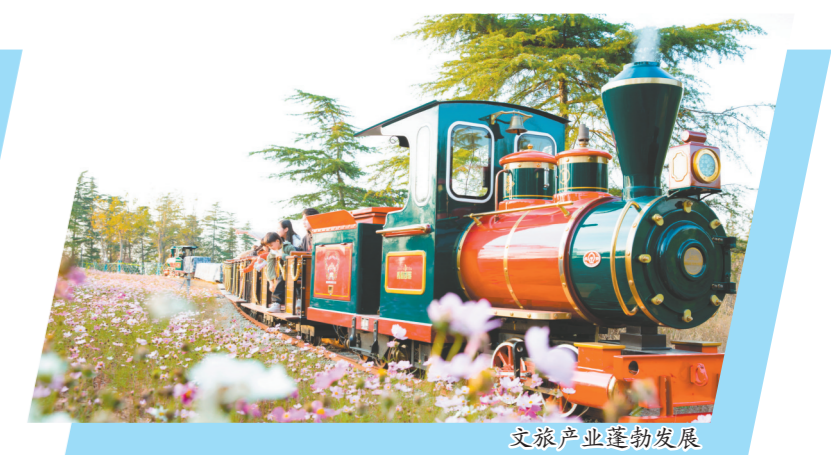
文旅产业蓬勃发展