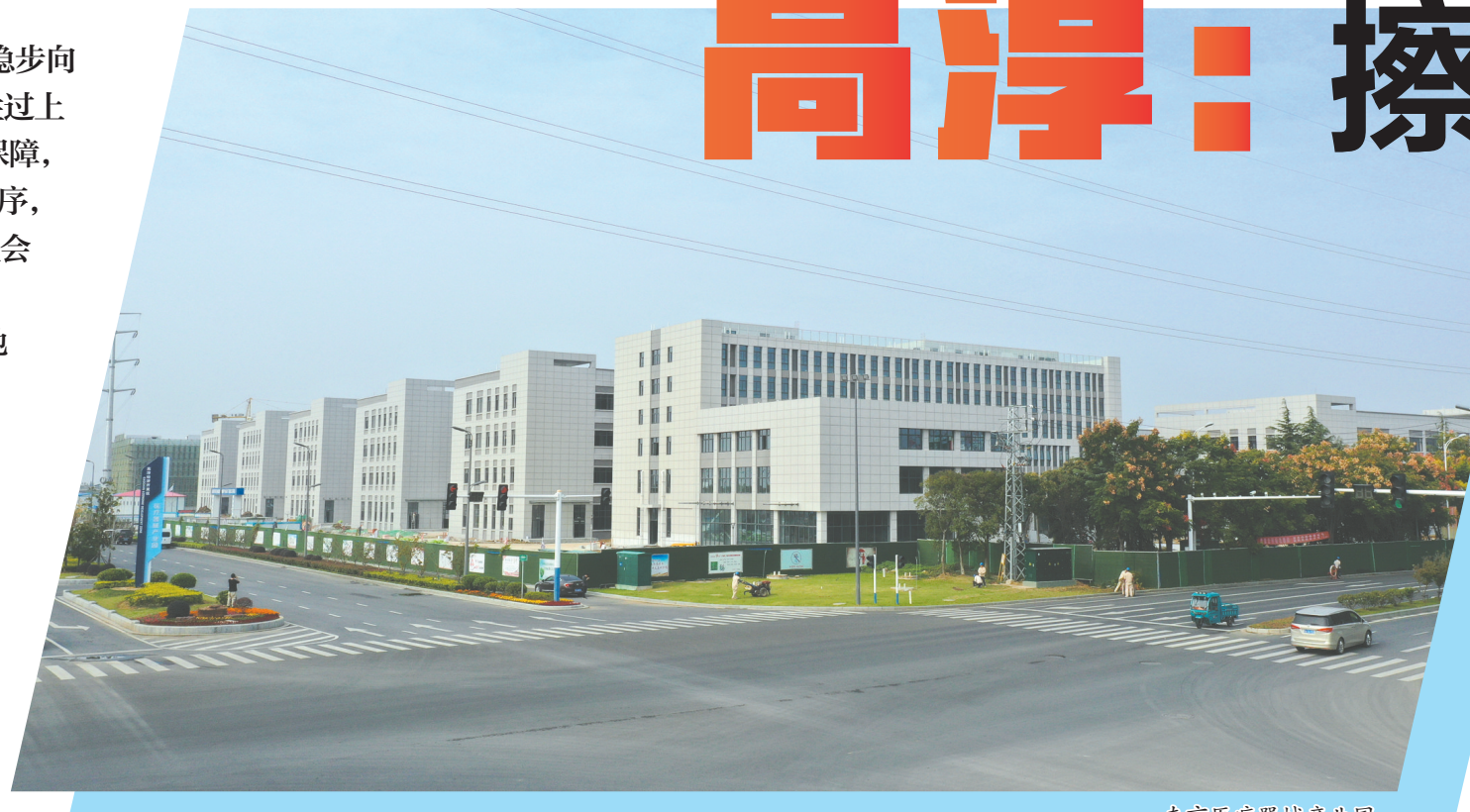
南京医疗器械产业园