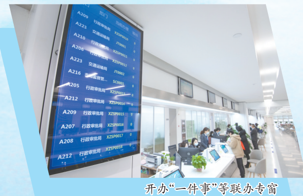
开办“一件事”等联办专窗