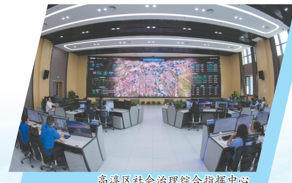
高淳区社会治理综合指挥中心