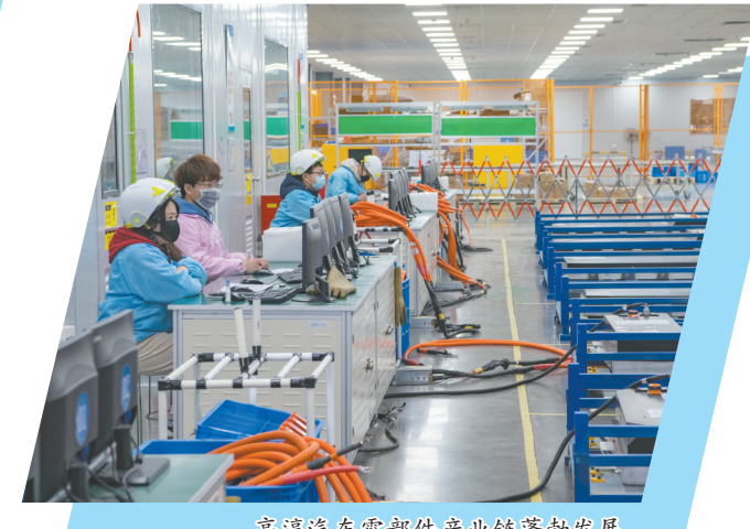
高淳汽车零部件产业链蓬勃发展