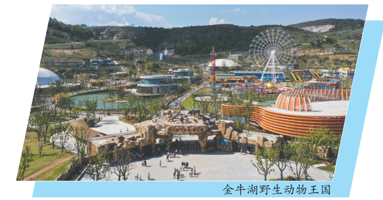
金牛湖野生动物王国