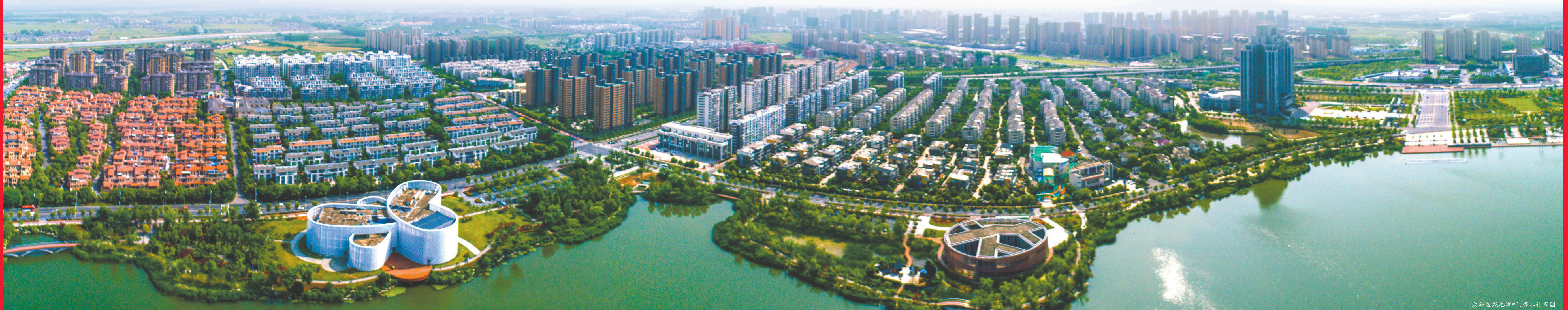
六合区龙池湖畔，秀水伴家园