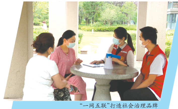
“一网五联”打造社会治理品牌