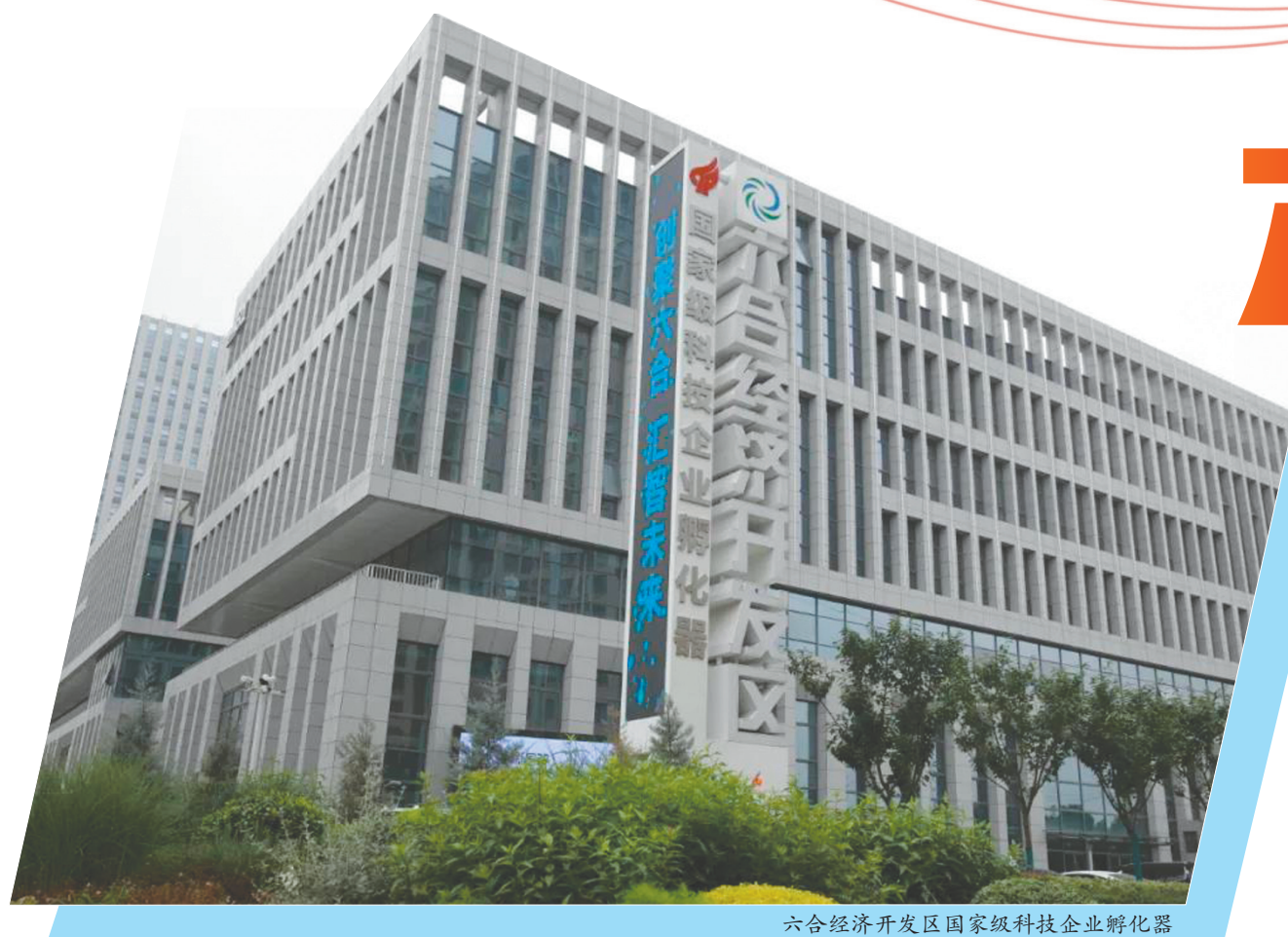
六合经济开发区国家级科技企业孵化器