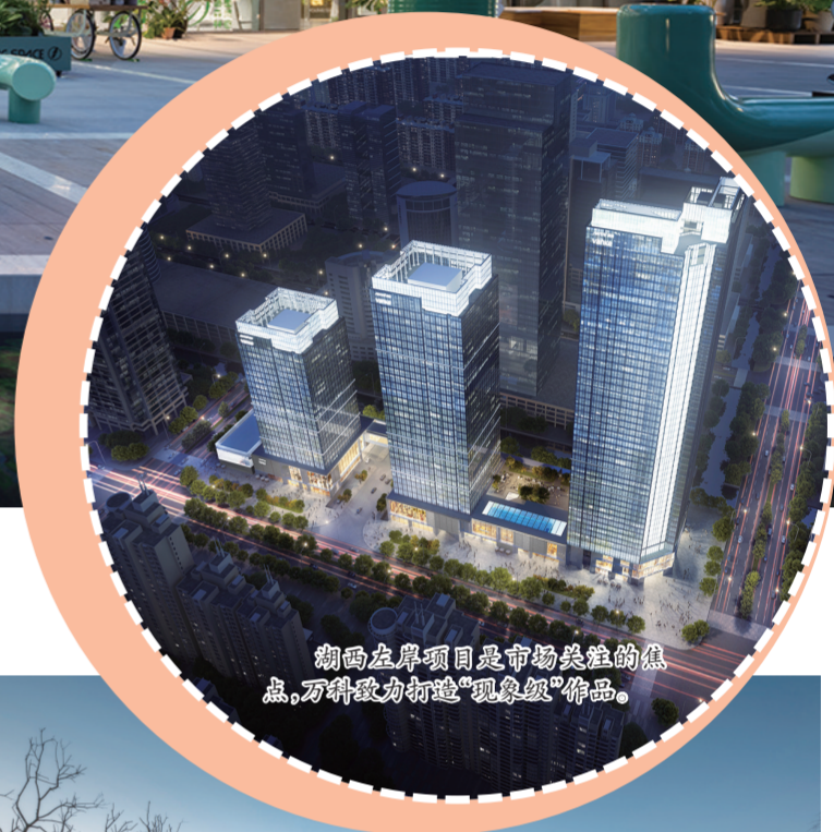
湖西左岸项目是市场关注的焦点，万科致力打造“现象级”作品。