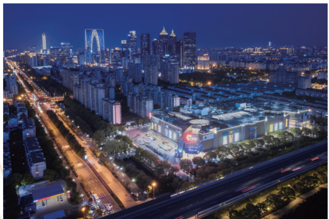
万科苏州印象城，丰富业态让生活更精彩。