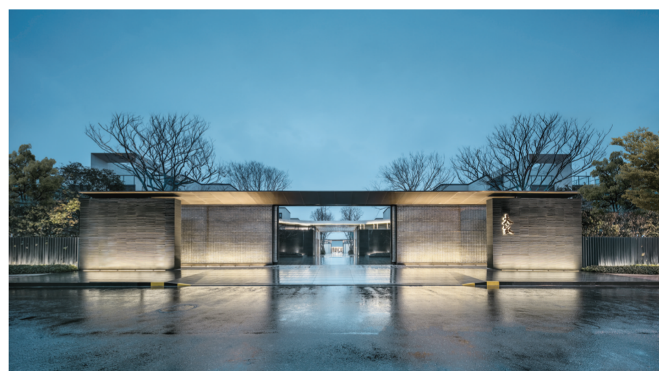
经过与大师更深层次的探讨、实践及思考后，万科将不断创新引领的“大字系”产品带到了苏州，大家项目便是其中的佼佼者。