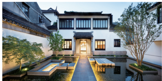
万科有熊酒店，让百年老宅焕发新生。