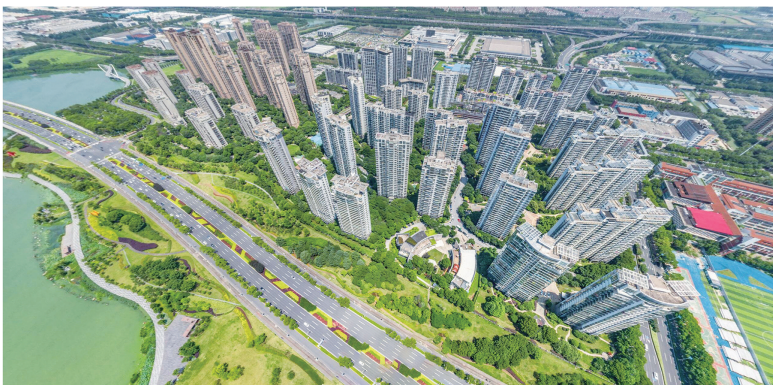
玲珑湾是万科进驻苏州打造的首个项目，是许多苏州人心中的理想居所。