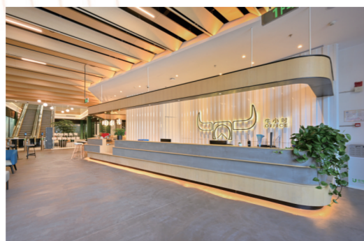
在共享办公领域，万科创新打造牛小时Office。