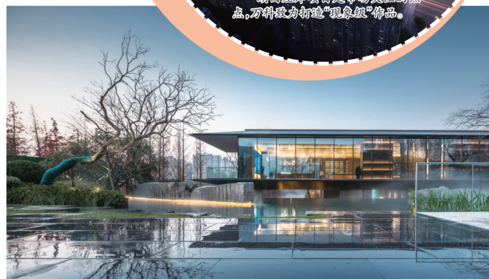
基于“以人为本”的产品理念，万科为新中产群体研发全新产品系——“上字系”，上湾璟园项目便是其中之一。