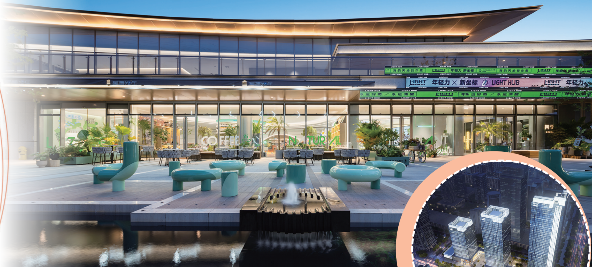
继“大字系”“上字系”之后，万科以“光年系”新品让年轻人找到自我领地，让美好故事不断发生，星月光年是苏州万科首个“光年系”项目。