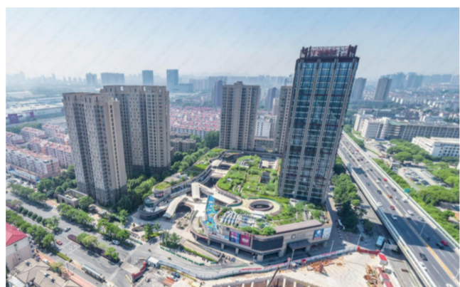
万科打造美好广场，更好地满足市民消费需求。