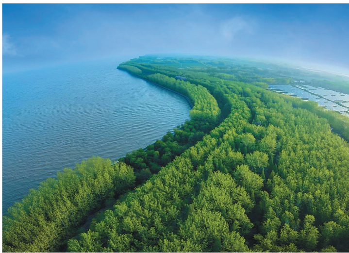
延伸70多公里的洪泽湖生态绿堤。