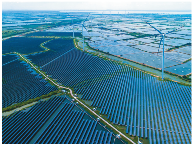
占地面积1600亩的常州市武进区前黄镇渔光互补光伏发电基地,实现了“上面发电、下面养殖,科学发展,综合利用”的渔光一体模式。

从“一城煤灰半城土”变为“一城青山半城湖”的徐州,从“垃圾围城”变成全省闻名生态镇、电商镇的宿迁市耿车镇,“腾笼换鸟”实现华丽转身的张家港东沙化工园等,都是江苏不断优化生态环境的缩影。8500万江苏人民将以大地作纸、以奋斗作笔,努力把江苏建成美丽中国示范省。