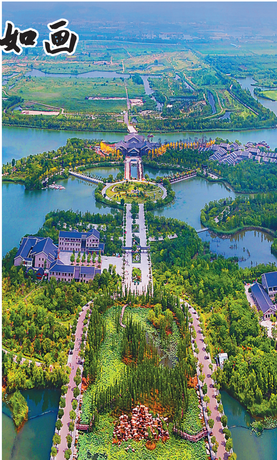
徐州潘安湖凤凰涅槃,由昔日采煤塌陷地,蝶变为最美国家湿地公园。