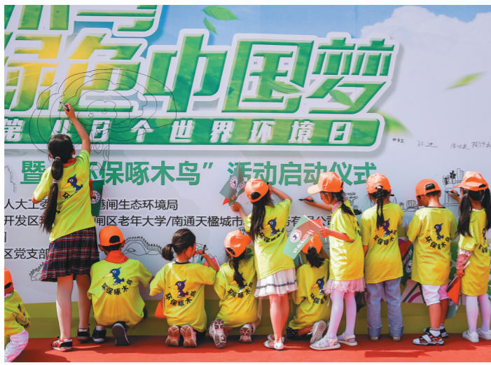
第48个世界环境日,南通小学生以绘图签名倡导“美丽中国,我是行动者”。