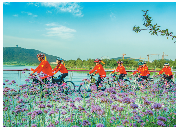
一群快乐骑行者在南京溧水辛庄湿地公园花海。