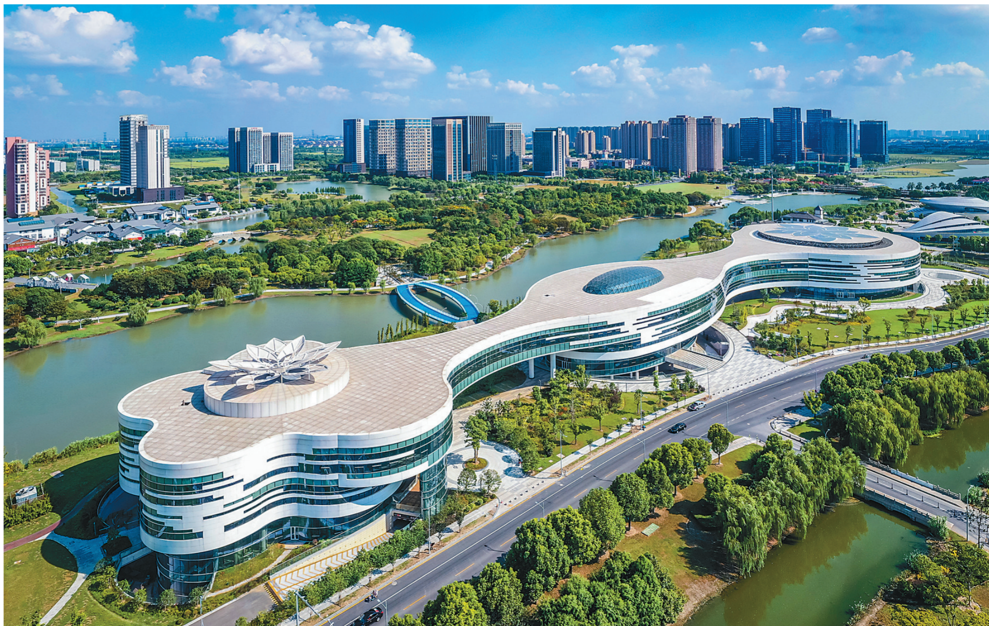
昆山开发区获评全国首批“绿色生态(双碳)示范园区”,将绿色低碳融入到产业结构、城市建设、生态环境治理等发展全领域、全过程。