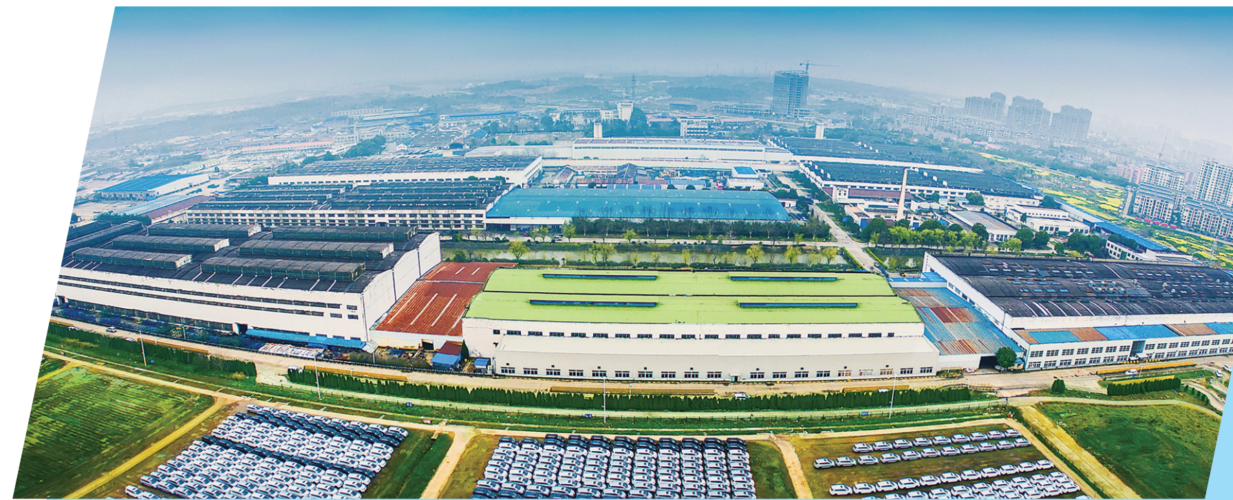
国家火炬特色产业基地——溧水新能源汽车产业基地