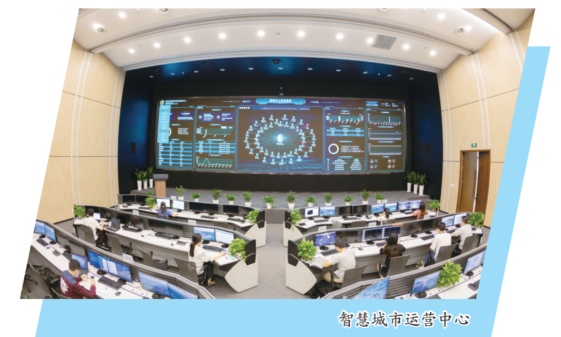
智慧城市运营中心