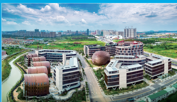
国家级的花露香在种植产业园