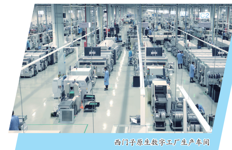
西门子原生数字工厂生产车间