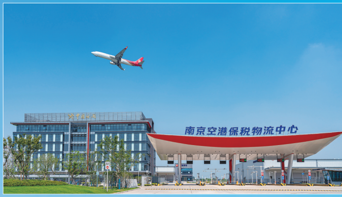
空港保税物流中心