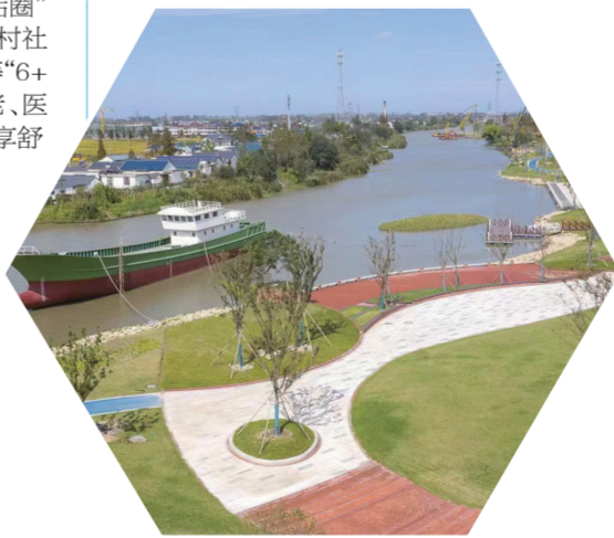
东台串场河风光带