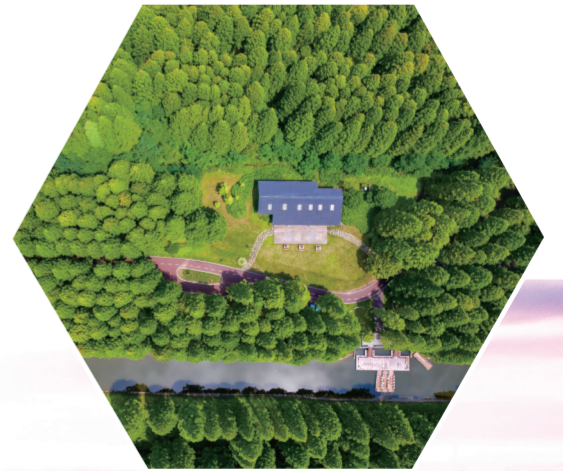
东台黄海森林公园