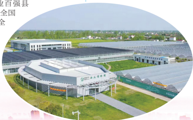
东台三仓西瓜博物馆

去年，东台在全国县(市)百强排位升至第38位，在中国工业百强县(市)、全国制造业百强县(市)等之外，再添全国创新百强县(市)、全国县域旅游综合竞争力百强、中国县域经济百强等荣誉。