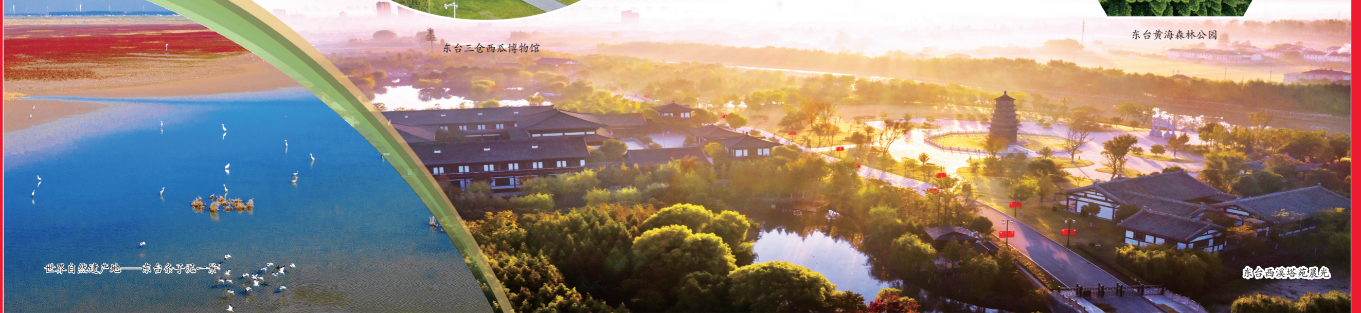
世界自然遗产地——东台条子泥一景