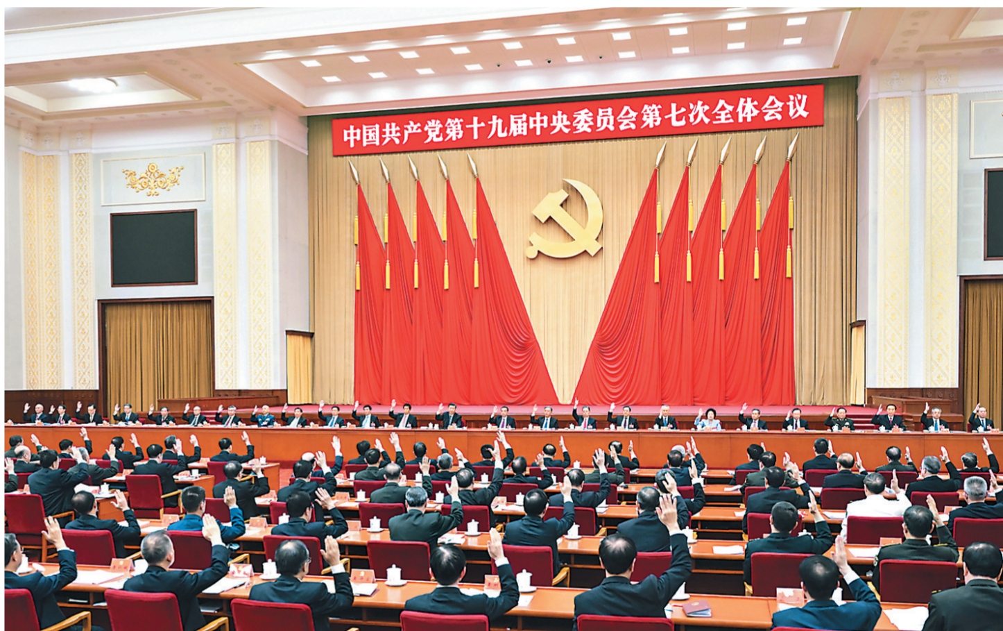
中国共产党第十九届中央委员会第七次全体会议，于2022年10月9日至12日在北京举行。中央委员会总书记习近平作重要讲话。新华社记者 鞠鹏 摄