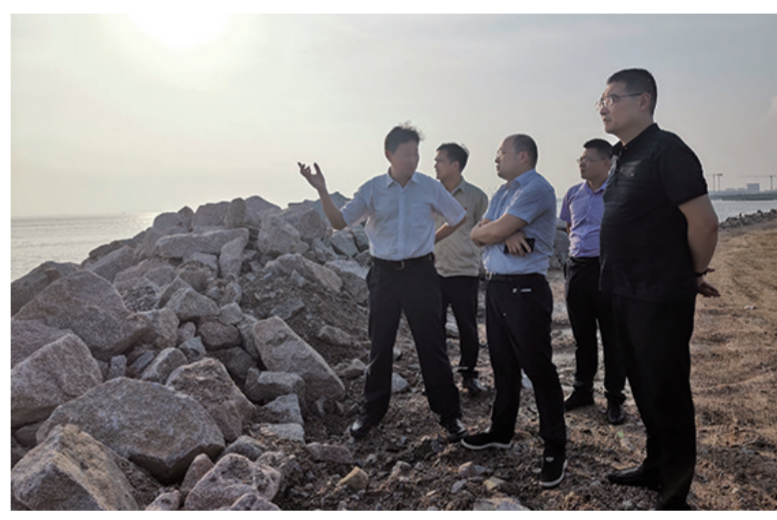
重点用海项目跟踪