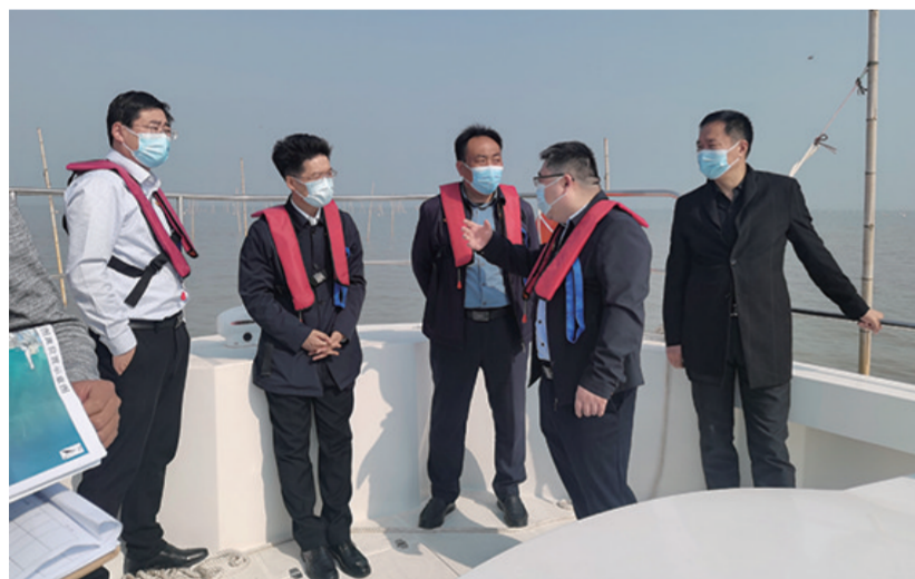
督查违法违规用海清理整治工作