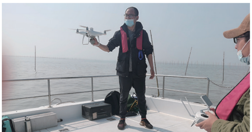
海上现场核查用海情况

为进一步规范海域使用管理,实现海域资源价值最大化,保障海洋生态环境安全和海洋经济高质量发展,连云港市赣榆区紧扣“高质量发展、后发先至”主题主线,在加大项目用海要素保障的同时,切实推进集约用海、生态护海。