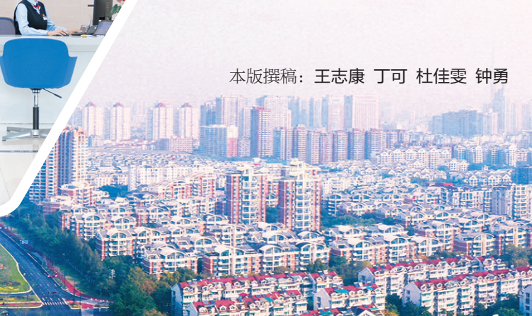
本版撰稿：王志康 丁可 杜佳雯 钟勇