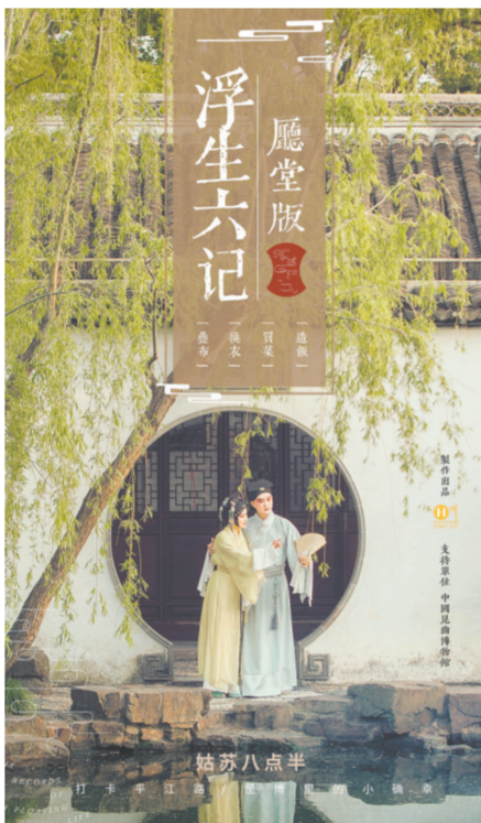
苏州园林新名片——沉浸式昆曲《浮生六记》

十年间,文化产业供给日益丰富,激发消费潜力显著提升。《2021—2022年度江苏文旅消费白皮书》显示,2021年江苏实现旅游消费总额3871.5亿元,较2019年恢复度为86.27%,旅游市场收入恢复近九成,态势良好。2021年常州青果巷文化旅游消费集聚区接待总量超800万人次,夜间游客数量超440万人次,营业收入超14亿元,成为江苏文旅消费复苏的一个缩影。作为江苏博物馆的典型,苏州博物馆文创产品的零售额自2016年至2019年间,实现了连续多年实现50%以上增幅,2021年全年实现文创产品销售额4305.89万元,再创新高。江苏省文化和旅游厅副厅长李川在第四届大运河城市文旅消费论坛上表示,江苏出台了一系列促进文化和旅游消费的政策措施,推出乡村旅游节、非遗购物节、“水韵江苏·有你会更美”文旅消费季等活动。这一系列促进文旅消费的“组合拳”,推动了全省文旅消费提质扩容,有效提升了了对经济发展的贡献度。