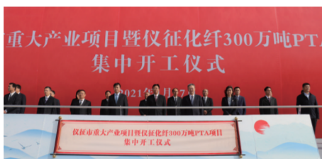
仪征市重大产业项目暨仪征化纤300万吨PTA项目集中开工仪式