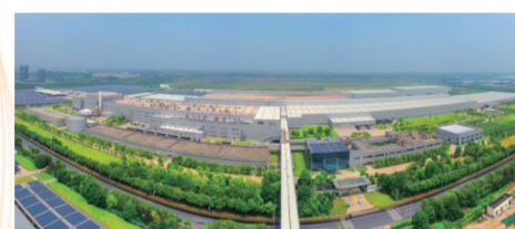
上汽大众仪征分公司