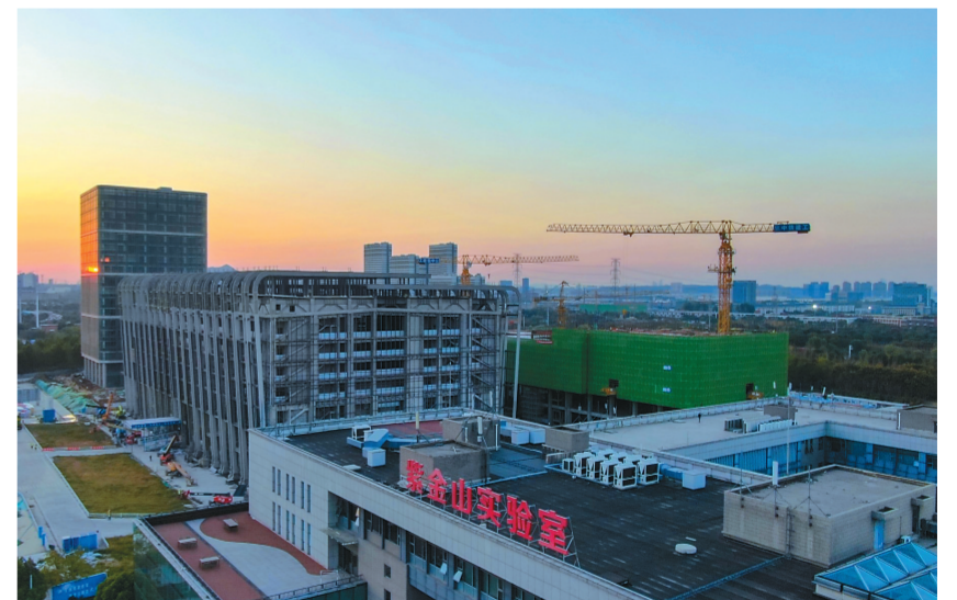
金秋时节,占地面积约230亩的南京综合性科学中心项目建设按下“快捷键”。紫金山实验室三期工程部分主体目前已经完工,正在进行内外装修。项目建成后,将加速未来网络产业集聚,大幅推动信息产业的升级和发展,极大提升江苏在网络与信息领域的科技竞争力。

本报讯(记者 顾敏)近日,省法院举办全省法院系统名校优生座谈会。省法院党组书记、院长夏道虎出席会议并讲话。 夏道虎指出,党的十八大以来,以习近平同志为核心的党中央高度重视法治建设,社会主义法治国家建设实现大跨越大发展大进步。年轻一代法院人要旗帜鲜明讲政治,坚定政治立场,强化理论武装、坚守法治精神,做绝对忠诚的新时代法院青年;要锤炼过硬本领,不断提高办案能力、调研能力、创新能力,做可堪大用的新时代法院青年;要扎根基层锻炼,涵养人民至上的“大情怀”,练就群众工作的“基本功”,做实司法为民的“真功夫”,做一心为民的新时代法院青年;要严于律己,始终保持年轻干部应有的清醒和纯粹,自觉扣好廉洁干事的“第一粒扣子”,做清正廉洁的新时代法院青年。 2020年以来,省委组织部会同省法院组织开展法院系统名校优生专项选调,目前已从北京大学等18所知名院校选调2批次80名名校优生。