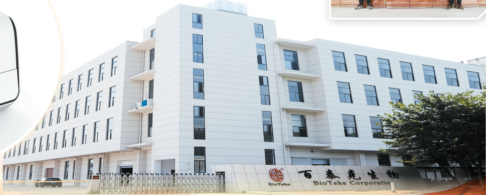
百泰克生物 BioTeke Corporation