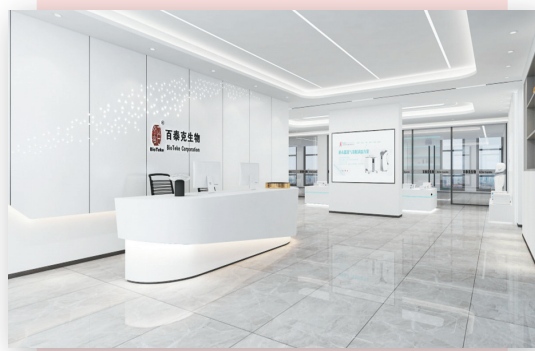
百泰克生物办公区