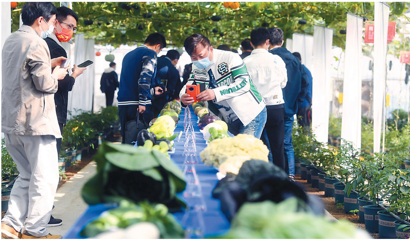
昨日,第六届中国·江苏蔬菜种业博览会在南京江宁宁谷里现代农业产业园举行。

江苏是农业大省,也是教育大省。“建设农业强、农村美、农民富的新时代鱼米之乡”,是江苏现代化建设的重点工作之一。相信随着更多科技小院走进乡村,更多创新机制赋能乡村,会让更多“好种子”结出“好果子”,让更多农户变“丰收在望”为“丰收到手”,让新时代鱼米之乡更加美丽宜居。