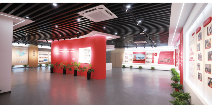
石材市场党建展厅