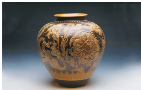
凤戏牡丹 李守才制

2014年11月，宜兴均陶制作技艺被列入国家级非物质文化遗产项目。李守才(作者系中国工艺美术大师、“轻工”大国工匠、国家级“非遗”宜兴均陶制作技艺代表性传承人)