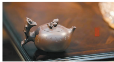
圣恩桃壶 陈成与陈佩秋合作