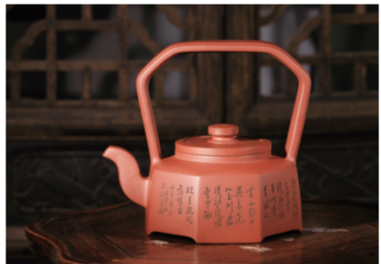
祥和提梁壶 王国祥制