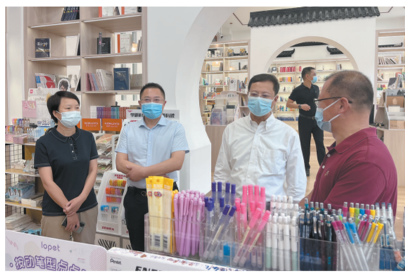
阅读空间——慕燕书吧

教师是教育高质量发展的第一资源。燕中高度重视教师队伍培养，加大师资培养力度，特别是优秀教师的培养。借鉴最新的人力资源管理理论和经验，专门成立教师发展中心，成立名师工作室，制定教师培训、培养规划，为教师专业发展搭建绿色通道，构建快速成长的立交桥；学校完善了教