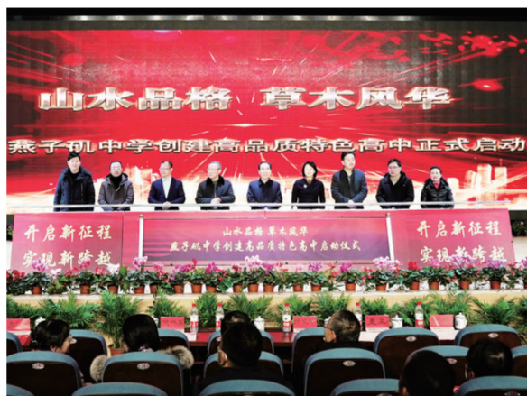
高品质特色高中启动仪式