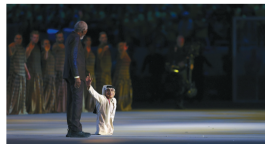
20日,2022年国际足联世界杯大使加尼姆·阿尔·穆夫塔(右)在开幕式上。

20日晚的卡塔尔世界杯开幕式上,一位双手支撑身体行走、只有上半身的男孩出现在海湾球场中央,成为观众最为难忘的场景之一。