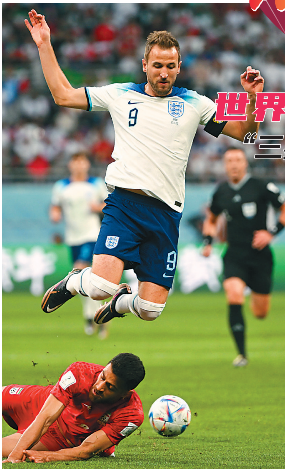
21日,英格兰队球员凯恩(上)在比赛中拼抢。