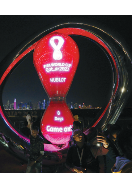
20日,球迷在多哈海滨大道的倒计时钟前留影。

卡塔尔世界杯足球赛20日如约而至。这是首次在北半球冬季举行的世界杯,虽然是冬天,但由于卡塔尔属热带沙漠气候,白天气温依然能达到30多摄氏度,冬日暖阳助推