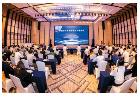
中国软件名园座谈会