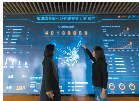
智慧物流“独角兽”运满满

展馆呈现精彩，论坛丈量高度。紧靠大会“软件赋能 数智转型”主题，雨花台区、软件谷11月23