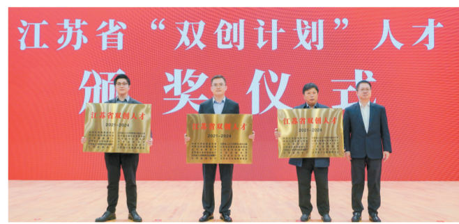
江苏省“双创计划”人才颁奖仪式