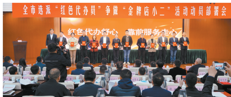
全市选派“红色代办员”争做“金牌店小二”活动动员部署会

今年以来，丹阳系统落实党中央“疫情要防住、经济要稳住、发展要安全”重大要求，高效统筹疫情防控和经济社会发展，统筹发展和安全，知重负重、勇担责任、多作贡献，以实干实绩扛起“勇挑大梁”重大责任。