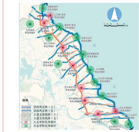
江苏省沿海风貌特色规划