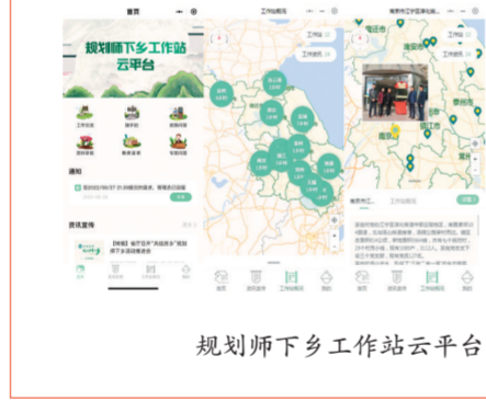
规划师下乡工作站云平台

示范引领作用,推动我省规划设计行业走在全国前列”要求,聚焦“做生态、做价值、做集成”的战略思路和策略,实施“五位一体”创新机制,链接技术与市场,连接市民和政府,联结生活与未来,以创新思维、新技术解决前进路上的新问题,一步一个脚印共同把党的二十大精神擘画的宏伟蓝图落在江苏的大地上。创新驱动实质是人才驱动,集团以专家人才为支撑点,以识才的慧眼、育才的良方、用才的胆识、聚才的诚意,培养出、吸引到越来越多的优秀人才。创新推动传统“师带徒”培养向系统化培养转变,探索建立完善内部培训体系,自主开发15个主题、33门课程的项目负责人培育课程体系,组建起42人规模的内训讲师队伍;努力培养造就青年科技人才,让青年人才挑大梁、当主角,融合“观摩+研讨”“套餐+小灶”等多种方式,培育卓越青年规划师队伍;深化人才发展体制机制改革,打造岗位、绩效、薪酬三位一体激励机制,为人才发展搭建舞台、注入动力。集团已成为优秀规划人才集聚高地,拥有国务院特殊津贴专家5名、江苏省设计大师3名、省有突出贡献中青年专家6名、省“333工程”中青年科学技术带头人50余人,