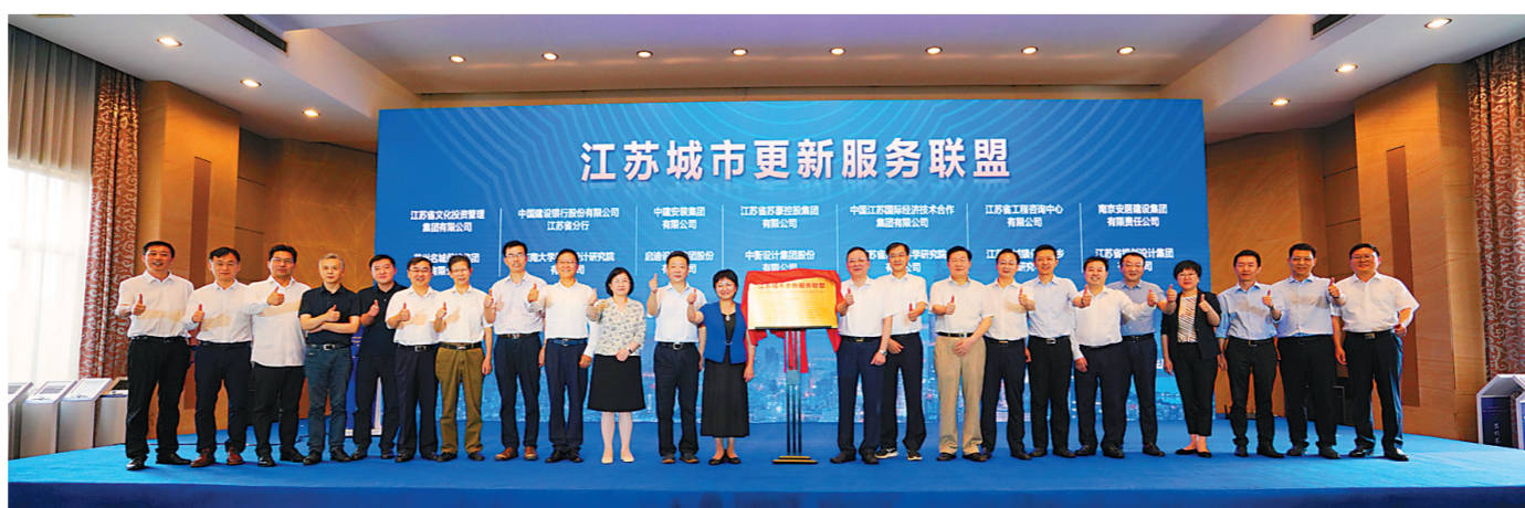
江苏省城市更新服务联盟成立

号角声声催奋进,奋楫扬帆帆正好。年轻豪迈的规划人斗志昂扬、整装前行,用内心感应时代脉搏,用脚步丈量祖国大地,始终争做中国式现代化建设的“先行者”、行业发展的“排头兵”,推动高质量发展的“追梦人”。(作者单位:江苏省社会科学院区域现代化研究院)