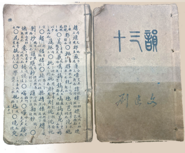
目前所知最早的石印本《考古奇本十三韵》