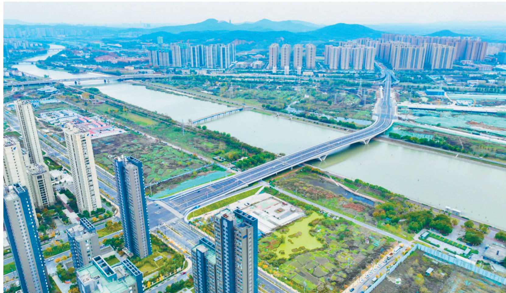
近日，南京市山与河西南的快速连接，片区内十四万居民出行更加便捷。该桥梁全长约一点二公里，实现

让青春力量在基层社会治理中绽放，需要创新先行、阵地保障。从机制创新到模式创新、技术创新，一系列有益的探索都应当鼓励。今年4月，南京外卖配送行业党委的成立，让外卖骑手有了组织。党建引领的一大优势，是党员的党性和社会治理的公益性高度统一，树榜样、立示范能有效提升群体的思想境界，还能同步提升青年参与社会治理的能力。不少地方依托共青团、孵化以志愿服务为主要功能的青年社会组织，支持他们立足基层、聚焦需求，进行自我管理。各地建设的“青年之家”“红蜂驿站”等，正是阵地建设的缩影。让在外奔波的青年有地方充电、打水，遇到困难可以有人去说，这份关爱是提升青年归属感、幸福感的基石。在爱心的传递下，青年的朝气、锐气、才气，将源源不断地注入基层治理中。以基层治理为目标，以机制和阵地为抓手，让青年于细微处为社会带来改变，中国青年“脚踏实地、胸怀天下”的家国情怀，必将为中国式现代化道路上美丽的风景。