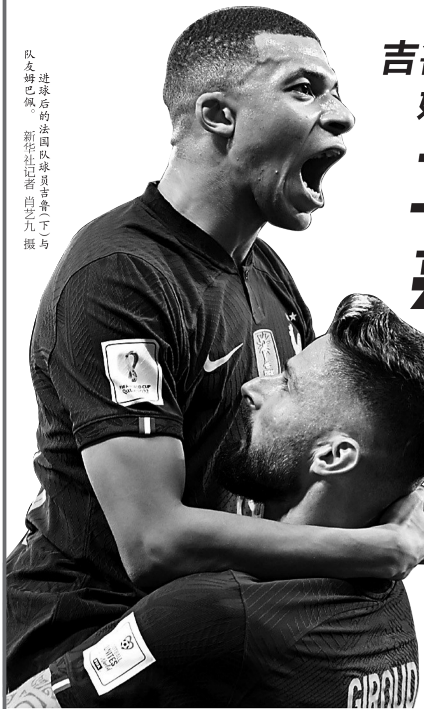
进球后的法国队球员吉鲁(下)与姆巴佩。