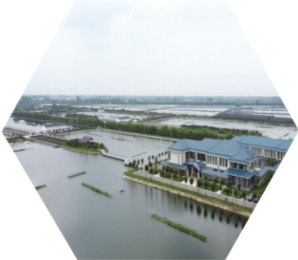
正源创辉水产养殖