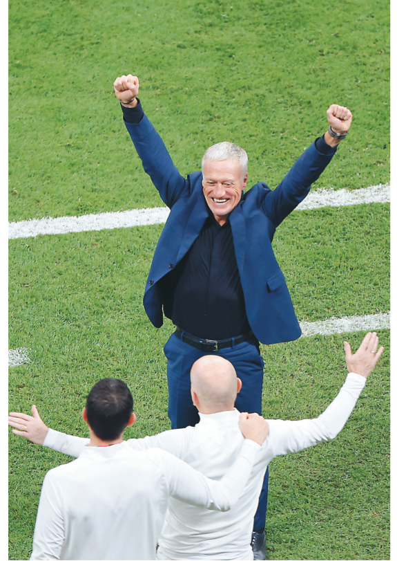
12月14日，法国队主教练德尚(上)在比赛后与教练组成员庆祝胜利。

既然看不到梅西大战C罗，梅西决战姆巴佩肯定是全世界吃瓜群众最喜闻乐见的一个场景了。 展望决赛，两队门将的能力可谓伯仲之间，阿根廷除了梅西这个点占据优势，其余9个位置都要妥妥的下风。这可怎么踢？梅西的球迷中，很多人期待摩洛哥在半决赛中继续爆冷，其实就是希望阿根廷在决赛中不用遭遇强大的法国队。 但足球毕竟不是打牌，摸到一手烂牌就必输无疑。在场上，54岁的德尚对阵44岁的斯卡洛尼，主帅的斗智同样有看头。 德尚的球员生涯可谓荣誉等身，最终以法国队队长的身份夺得1998年法国世界杯；退役之后执教摩纳哥队杀入欧冠决赛，在尤文图斯和马塞相继取得成功后晋级国家队，2016年欧洲杯亚军和2018年俄罗斯世界杯冠军已经让他跻身顶级名帅行列。 斯卡洛尼的职业生涯显得那么寒酸：踢球最高荣誉是西甲冠军，2006年德国世界杯国家队替补球员……执教阿根廷队的经历更是妥妥的魔幻现实主义，如果不是阿根廷足协没钱请大牌教练，这位执教经历几乎为零的“临时工”和他的草台班子哪有能执教国家队的？虽然美洲杯拿到一个季军和一个冠军，但含金量和德尚相比不可同日而语。 德尚这个霸道总裁是拿着一手90分的牌，想办法打出90分的效果；斯卡洛尼这位天生打工人拿着75分的牌，还逼着他亮剑，要跟德尚扳手腕。 足球场上最怕什么对手？明明实力强、阵容齐、偏偏姿态低、苟着踢。法国开赛前伤了几乎半个主力阵容，德尚务实的战术思想是一路杀进决赛的关键：有格里兹曼调度，有姆巴佩反击，恨不得把控球权交给每一个对手。很显然，德尚绝对是号准了胜利的“脉搏”。 斯卡洛尼不是不想亮剑，但手里除了梅西这个王炸，其他牌实在不给力啊。他能够带队走到现在，靠的是解决了三个主要矛盾：找对了阵型、找对了打法、找对了梅西的使用方法，并用一连串的胜利提升了全队的凝聚力，让阿根廷球员们不再有“一将无能累死三军”的抱怨。决赛中阿根廷想要以下克上，梅西自然要有近乎完美的发挥，斯卡洛尼也必须尽最大可能通过打法的设计抵消法国队的优势，把比赛推向不可控和不可知的方向。 可以预期，比赛不可能是开放式的对攻，双方的首选策略都是放弃控球打防守，但如果鏖战多时没有结果，主帅的变阵变招就可能是关键。 《笑傲江湖》之中，令狐冲问道：“要是敌人也没招式呢？”风清扬道：“那么他也是一等一的高手了，二人打到如何便如何，说不定是你高些，说不定是他高些。” 真要到这个时候，斯卡洛尼其实已经是赢家了。 期待这样的场景。