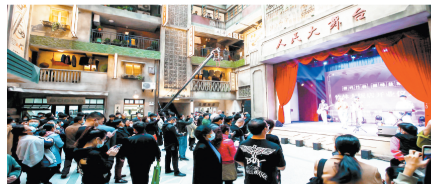
盐城市深入推进文化产业“六个一”工程,突出特色文化街区的打造提升,实施“街区+”行动,不断加强城市更新升级,传承挖掘传统文化,创新文化消费场景。

“街区+业态”,提升街区消费力。合理规划布局街区业态,引进国际国内知名文化品牌,发展当地特色品牌,推进“老字号”传承和创新。增强休闲娱乐功能,更好满足个性化、多元化消费需求,使街区兼具文化展示与体验、游览、购物、餐饮、休闲娱乐等多种功能。借助光影+数字多媒体+文化创意等手段,通过裸眼3D、光影演艺、多媒体艺术等形式聚集人气,实现商业与文旅的跨界融合,激发文化旅游消费需求。围绕娱乐、餐饮、购物等七个重点方面发放消费券2000余万元,培育壮大新型消费,发挥消费对稳定经济发展的拉动作用,延伸夜间消费链条,增加休闲街区商业价值。大洋湾唐虞里入选省级夜间文化和旅游消费集聚区,欧风花街入选首批“江苏省示范步行街”。 盐服宣