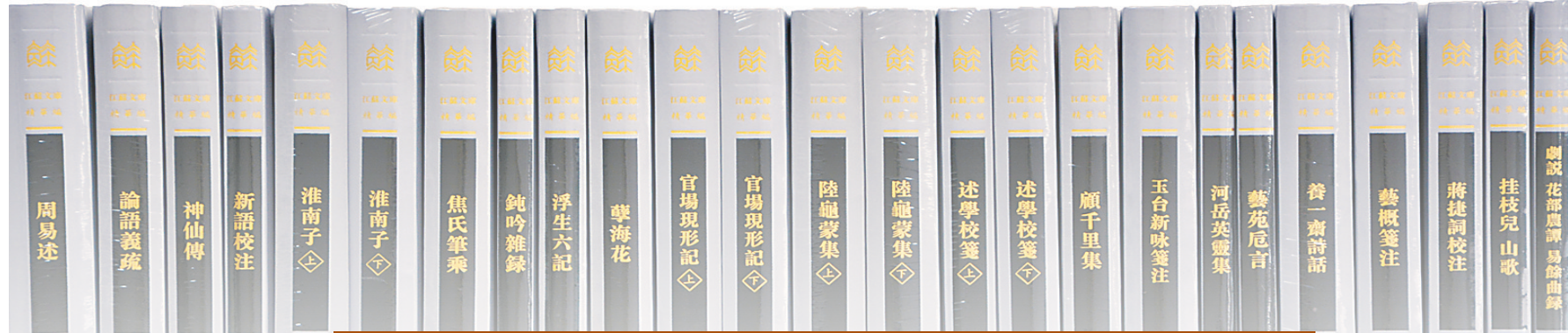
《精华编》已出版的古籍。