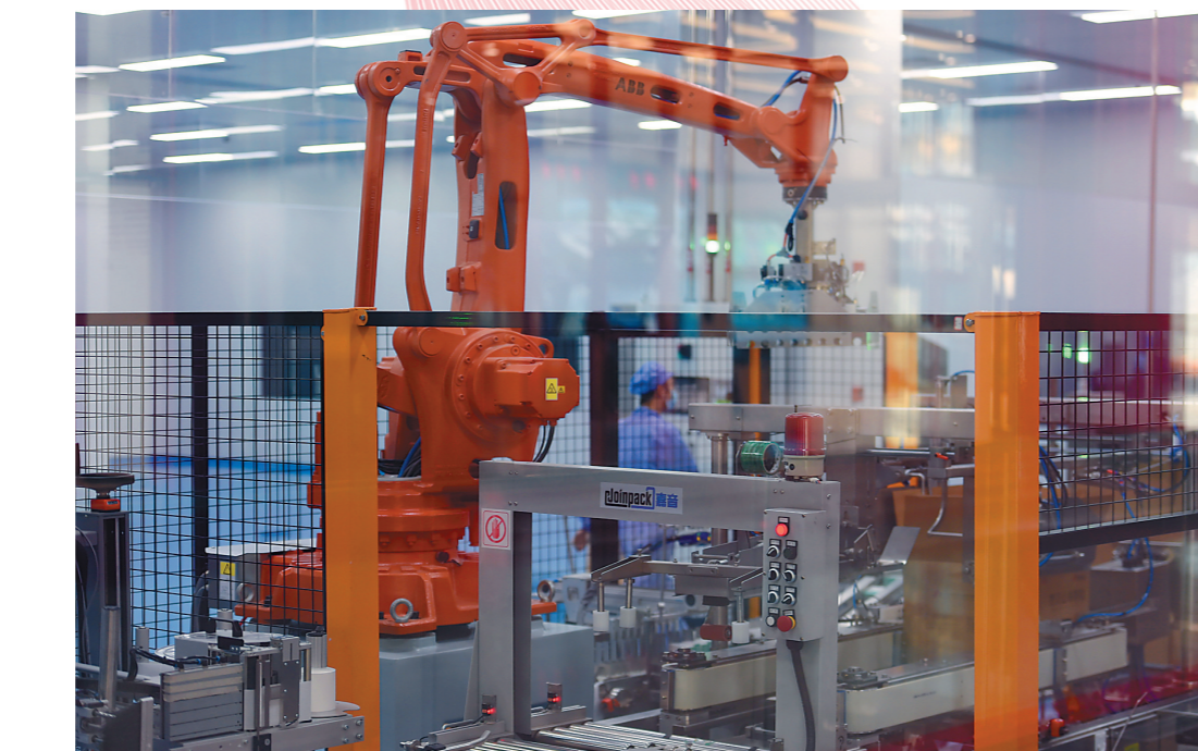
在中华药港,康缘药业实现生产系统全过程智能化、数字化跟踪追溯。