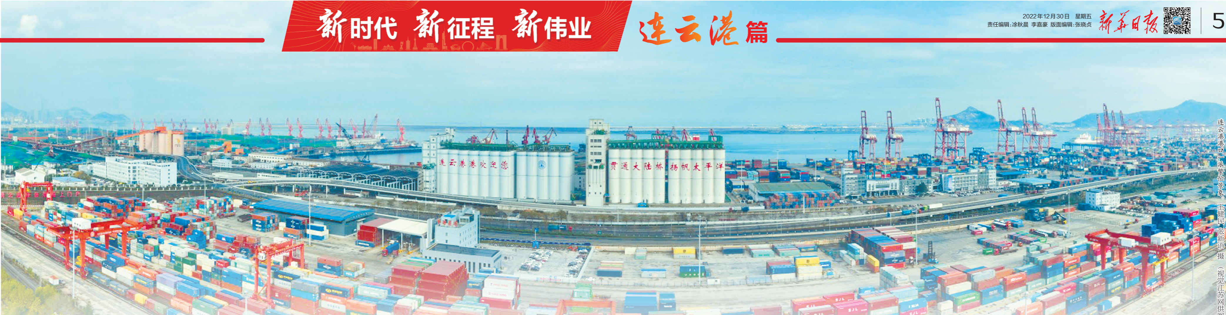
连云港港口吞吐量连续多年位居全国前列